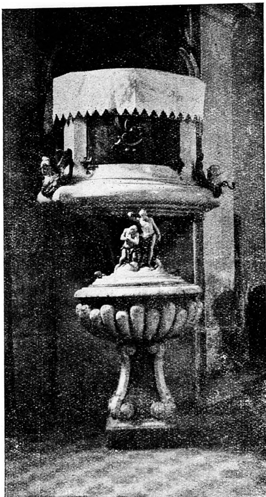
A pilisszántói r. kath. templom szószéke.

lentéktelen kőfaragó munka. Mellette és az északnyugati templomsarkon egy-egy római, hengeralakú mérföldmutató kő áll ki a földből.