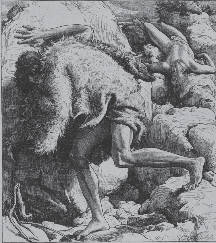
Káin és Ábel. A Dalziels' Bible Gallery részlete, 1880-81.