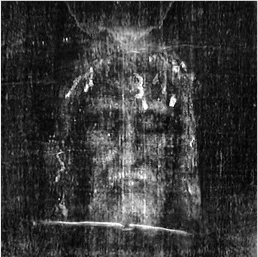
A torinói lepel Krisztus-arca. A leplet a hagyomány Jézus halotti lepleként tartja számon, a rajta – mindeddig nem tisztázott módon – rögzült arckép a Krisztus-ábrázolások tradíciójának egyik meghatározó, ún. „nem kézzel készített”, ezért hitelesnek tartott ősképe, „eredetije”.