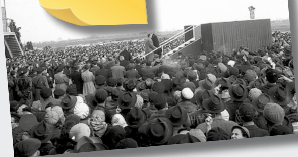
Kíváncsiak tömege Hruscsov látogatásakor

1958. április 2-án Nyikita Szergejevics Hruscsovot, az SZKP első titkárát köszöntötte népes tömeg a Ferihegyi repülőtéren. Olyan sokan voltak, hogy az utókor szemében érdekes momentumot örökített meg ekkor a fotós: akik a hátsó sorokból egyébként nem láttak volna semmit, a kifutópályának hátat fordítva, tükrök segítségével próbáltak elcsípni valamit az eseményekből.