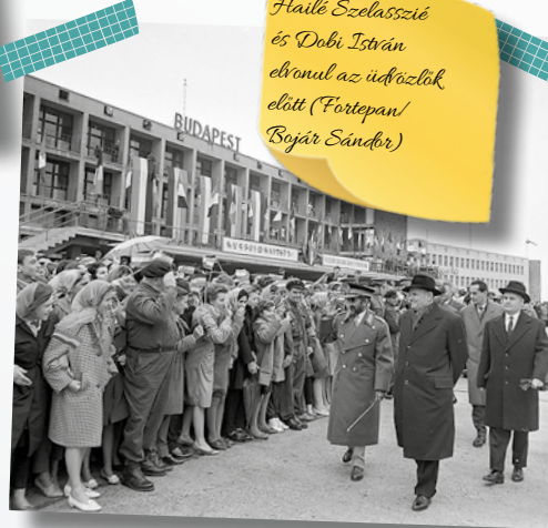
Hailé Szelasszié és Dobi István elvonul az időzítők előtt

Hailé Szelasszié, Etiópia császára az elnöki tanács elnökének meghívására tett háromnapos látogatást Budapesten. Az uralkodót Dobi István is búcsúztatta a repülőtéren 1964. szeptember 23-án. Az épületet ekkor etióp és magyar feliratokkal és zászlókkal díszítették, a betonon díszörség sorakozott fel.