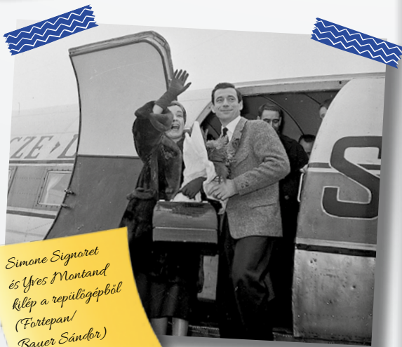
Simone Signoret és Yves Montand kilep a repülőgépéből

1957. március 9-én a világhírű énekes, Yves Montand és felesége, Simone Signoret is a lengyel légitársaság gépéből szállt ki. „Bonjour, Budapest!” – kiállította üdvözlésként Montand. A színésznőt – habár szintén világhírű volt – Magyarországon kevésbé ismerték, így azt ajánlották az újságíróknak, hogy tőle is kérdezzenek. Signoret arra a kérdésre, hogy milyen érzés egy filmben játszani egy olyan nagy művésszel, mint amilyen a férje, kellő szerénységgel, diplomatikusan válaszolt: „Yves Montand-nal együtt játszani nagy élmény. De ő eddig főként szonzenékes volt, most kezd filmezni. Nekem ez körülbelül... nem is tudom... hányadik filmem, jóval több a tucatnál.”