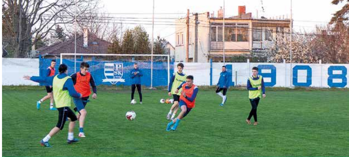
Feljutásra készül a PSK