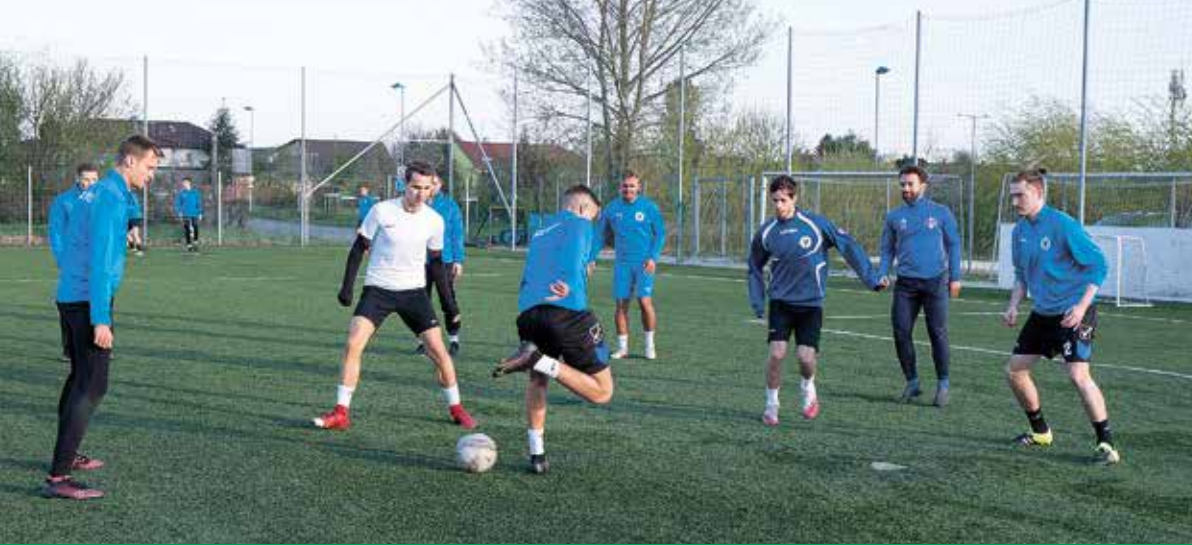
Edzésben a SZAC is