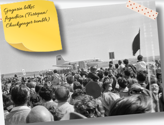
Gagarin lelkes fogadása

Hasonló trükkhöz folyamodtak akkor is, amikor 1961. augusztus 19-én Jurij Gagarin látogatott Budapestre. A világ első űrhajósát nemcsak Ferihegyen fogadták sokan, de végig tömegek álltak azon az útvonalon is, melyen a nyitott ZISZ gépkocsiból integető őrnagy konvoja elhaladt.