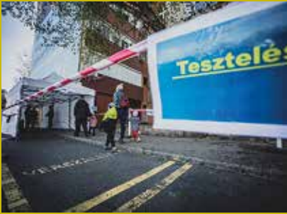
Az első körben több mint 1200 óvodást és kisiskolást sikerült tesztelni