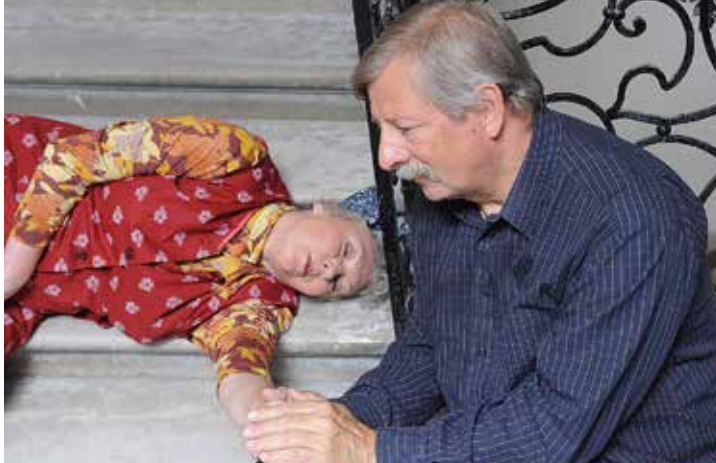
Nemcsak Vili bácsi, de a fél ország izgult, amikor Magdi anyus leesett a lépcsőn