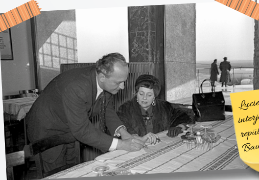
Lucienne Boyer interjút ad a Ferihegyi repülőtéren

A Ferihegyi repülőtér 1950-től számos hírességet láthatott – szó szerint átmenetileg – vendégül