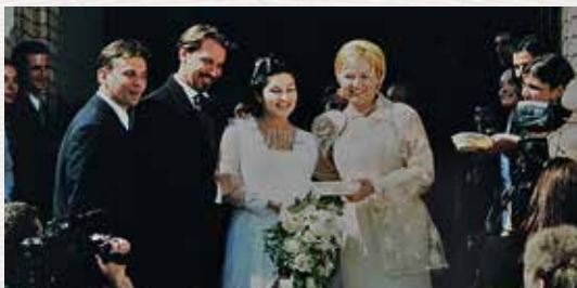
Fontos jelenet a korai időkből