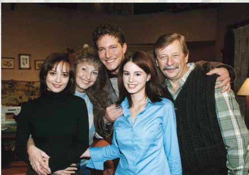
Főszereplők a kezdetekkor