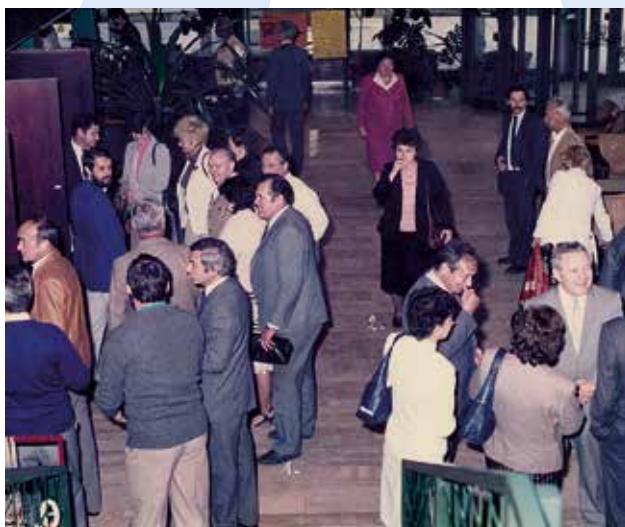
A közösségi ház előcsarnoka a megnyitón, 1986. június 3-án

A mintegy 1400 lakást magába foglaló területnek saját iskolája, temploma, kultúrháza és sportlétesítményei is voltak. Aztán az 1960-as években elinduló lakótelep-fejlesztési program részeként 1965-ben elkezdődött a mai Szent Lőrinc-lakótelep építése, majd 1978 és 1985 között két ütemben felépült a Havanna-lakótelep.