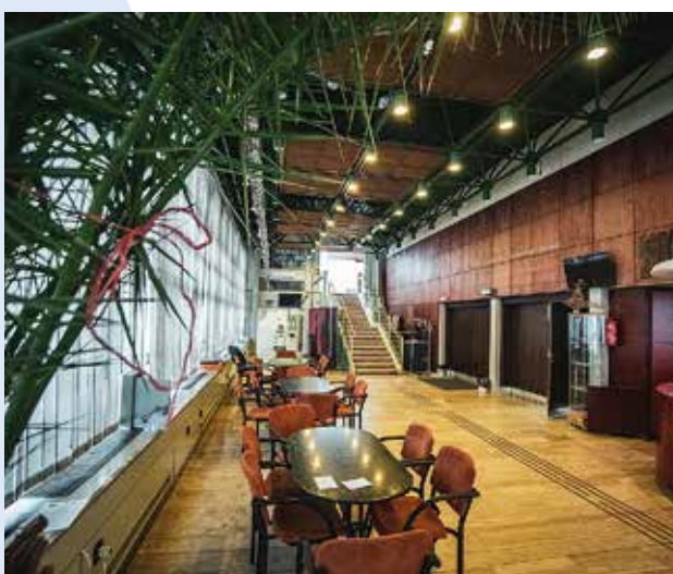
Az előcsarnok most