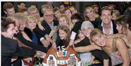
A 15. születésnap