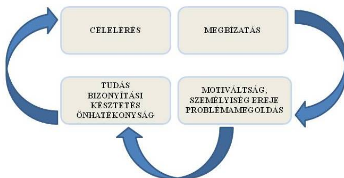
1. ábra. Az önállóság erőtere

A megbízatások, feladatok kihívást jelentettek a főhős számára. Lelkesen állt a problémamegoldáshoz, melynek folyamatában a személyiség erejével, erőfeszítéssel, meglevő tudása mobilizálásával jutott az önálló, sikeres megoldáshoz, a cél eléréséhez. A sikeres problémamegoldás segített az önhatékonyság megélésében.