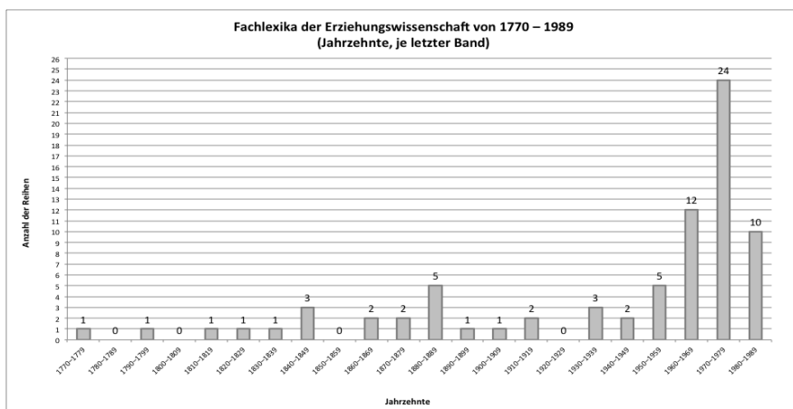
Abbildung 1: Verteilung der Lexika von 1774–1989

Wir haben nur Erstauflagen und solche Auflagen aufgenommen, die von seiten des Verlags als verändert und/oder überarbeitet markiert wurden. Bündelt man die Erscheinungsdaten der Lexika in Jahrzehnten und bezieht sich jeweils auf die letzte Ausgabe eines mehrbändigen Werks, ergibt sich folgende Verteilung (Abbildung 1) 3 .