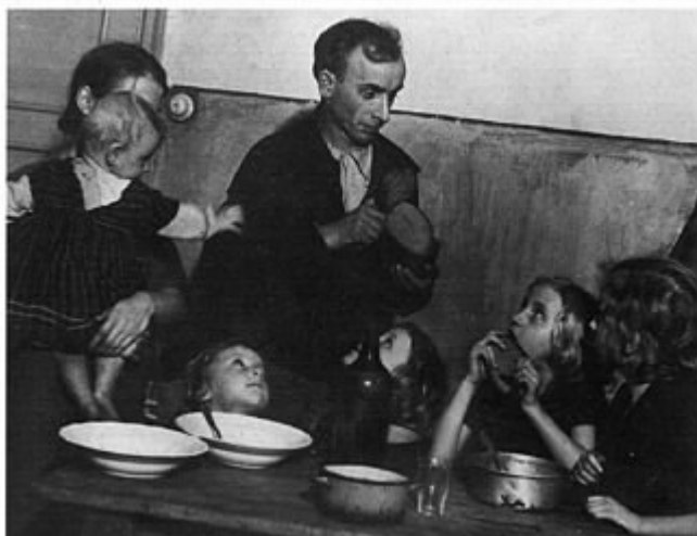
1. kép: Ötgyermekes óbudai munkáscsalád. (Escher, 2002)

sok, kubikusok és az uradalmi cselédek alkották. Az agrárproletárok száma 1900 és 1910 között 4–4,5 millió volt, kétharmaduk időszaki munkás, napszámos, egyharmaduk cseléd. A földmunkások külön csoportban tömörültek, az idénymunkásokkal együtt a munkássághoz tartoztak, összekötő kapcsot alkottak az ipari munkásság és a falusi szegények között (Romsics, 1999. 11–78. o.).