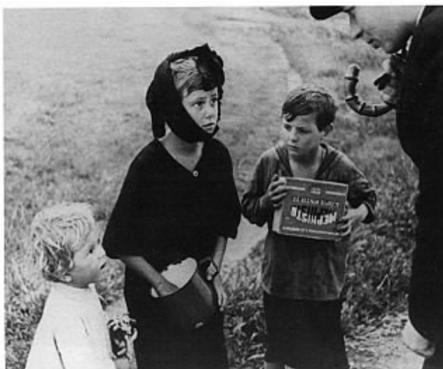
3. kép: Gyerekek a pesterzsébeti nyomortelepen. (Escher, 2002)

rakban. Egy besztecerbányai iparfelügyelő 1904-es jelentése szerint üveggyári telepen 8–9 éves gyermekeket foglalkoztattak napi 8 órás munkában ( Népművelés , 1906, 472–474. o.). Kiskorúakat dolgoztattak bányákban, vasöntőkben, ércolvasztókban, porcelán- és üveggyárakban, illetve a mezőgazdaságban is.