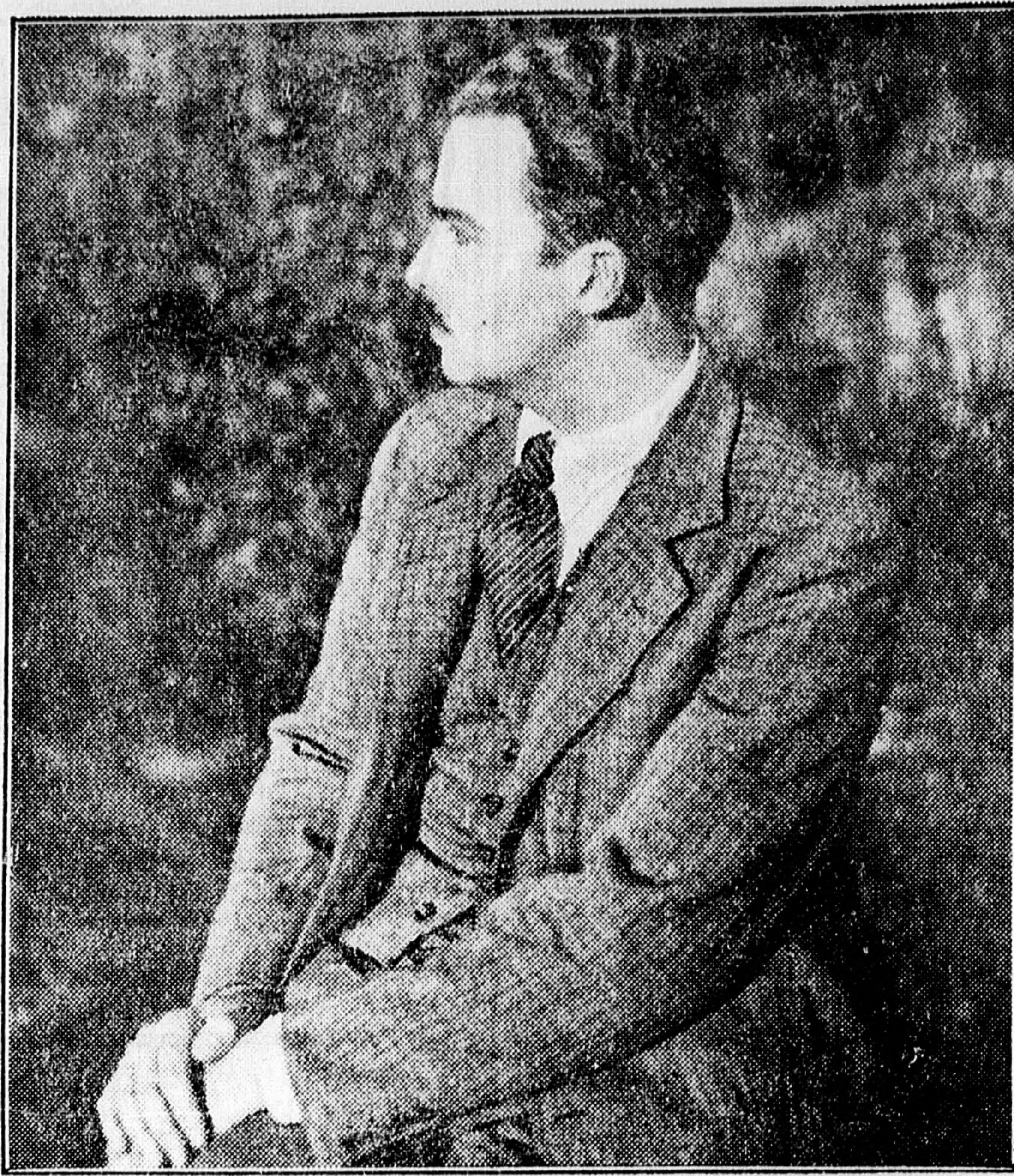
Ottó királyfi legújabb fényképe

(Degenfeld gróf felvétele, Steenockerzeelben, három nappal ezelőtt.)