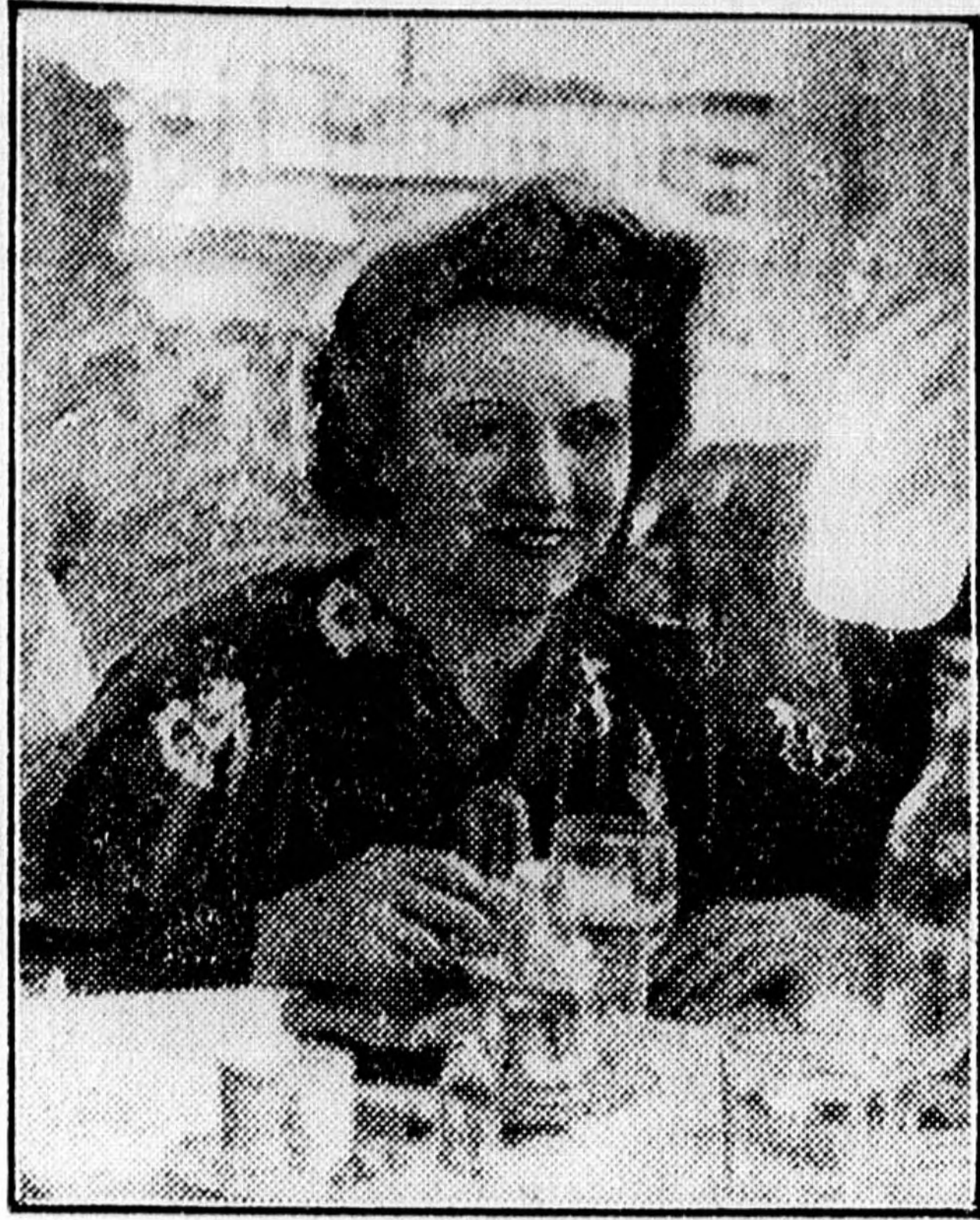
Ezt a Margitszigetet pedig leg- szívesebben kiásatnám és egy ha- jón átvitelném Amerikába.

(A Reggel tudósítójától.) A höl- gyek szíve — főként huszonkilencen felül — bizonyára megdöbben a hírre: