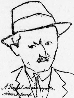
A Reggel című rajza. Aldozó József

Nem egy primitív ósiség jelentkezése ez a piktúra az Aldozó József művészetében; az ő művészete izgalmas furcsaságként, az impresszionizmus szédületes billentyűin jár-