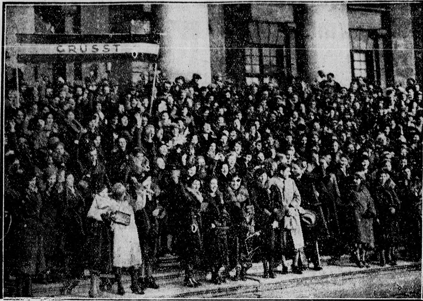
Münchenből jelenti A Reggel tudósítója: 425 pesti polgári-középiszkolás leány érkezett Münchenbe, akik visszaadják a müncheni iskolásleányok multévi budapesti vizitjét. A sugárzó magyar ifjúság látogatása lelkesedést keltett Münchenben, mindenfelé, amerre csak megfordulnak, szeretettel fogadják a pesti kisasszonyokat. A Reggel fülvétele a müncheni Nemzeti Színház előtt készült és bizonyára nagy érdeklődést fog kelteni a budapesti szülők körében...