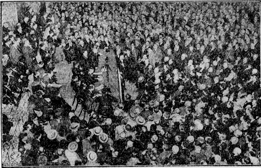
Bródy Ernő beszél a demokraták vasárnapi nagygyűlésén a Vigadó zsufolt termében

9000 főnyi közönség jelent meg. Olyan hatalmas demonstráció volt