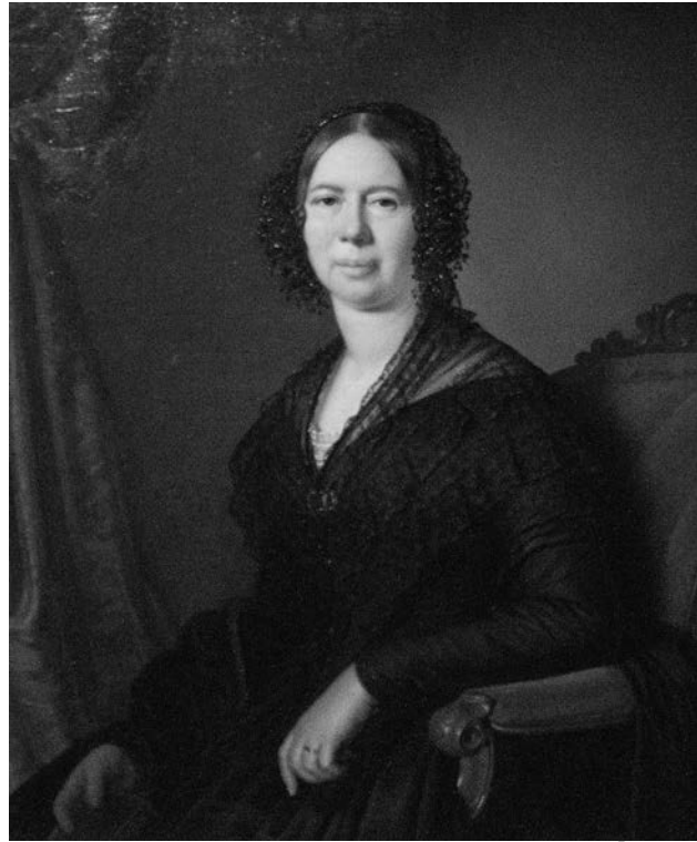
Mária Dorottyia főhercegnő (1797–1855)

A nagy munkabírású Wimmer számára a Modorban töltött 2 esztendő korántsem volt elfecsérelt időszak, és lelkipásztori teendőinek ellátása mellett intenzíven folytatta a már az 1830-as évek elején megkezdett földrajzi munkásságát. 6 Ugyanakkor miután modori éveit Pozsonyban kisebb-nagyobb szünetekkel, de lényegében folyamatosan ülésezett az 1832/1836. évi országgyűlés, ez nyilvánvalóan számos lehetőséget és alkalmat kínált számára, hogy több, a reformkor magyar politikai elitjéhez tartozó személlyel megismerkedhessen. Ezek egyike József főherceg nádor harmadik felesége, Mária Dorottyia főhercegnő volt. József főherceg, akit 1796-ban választottak Magyarországnádorává, 1819-ben vette nőül az evangélikus vallású württembéri hercegnőt. A Budán élő nádor és neje nyíltan rokonszenvezett az ország polgárosítását célzó magyar törekvésekkel és az azokat megfogalmazó személyekkel, amelyet a bécsi udvar egyáltalán nem nézett jó szemmel. Megismerkedésüket követően a mélyen vallásos Mária