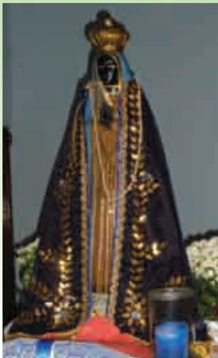
Koronáját a császár lányától kapta

Az első kápolna 1734-ben épült a Coqueiros-dombon. 1834-ben elkezdtek felépíteni egy nagyobb templomot, ami 1888. december 8-án készült el. Ekkor II. Péter brazil császár leánya, Izabella arany koronával és kék paláttal ajándékozta meg a szobrot.