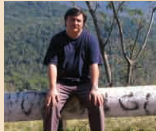
Néha pihenni is kell

– Én a hangtechnikával járultam hozzá az eseményhez. Egy akkora menet, amelyen ezer ember vesz részt, több száz méter hosszan is elnyúlhat. Ha nincs mozgó hangerősítés, szétszakadozik a tömeg hangja, és lehetetlen egységesen vezetni az énekeket, imádságokat, ami nagyon zavaróvá válhat. Autómmal én erről gondoskodtam.