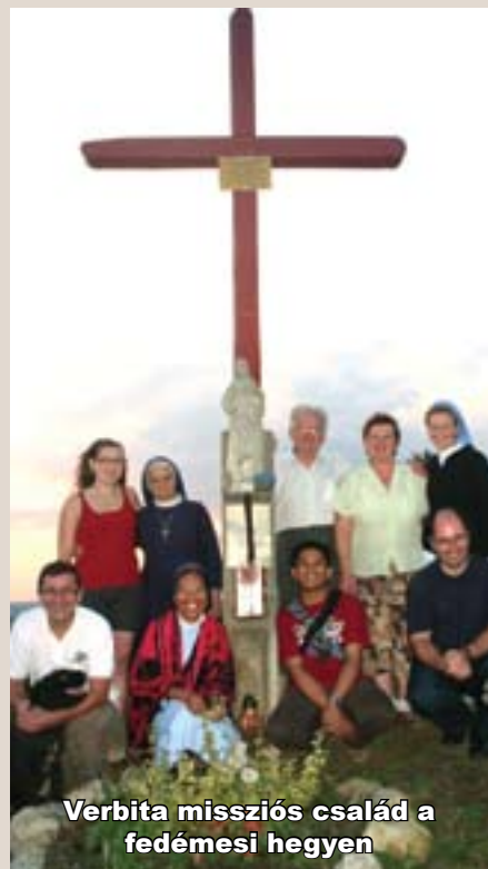
Verbita missziós család a fedémesi hegyen

2004-ben, a virágvasárnapi szentmise után, ahogy kiléptem a templom ajtaján, rávetődött a tekintetem a hegyen álló magányos fára. Ekkor egy belső hang szólt: „Állíts ma oda egy keresztet!” A nap folyamán egyre erősebb lett bennem az érzés, hogy eleget tegyek ennek a „felülről jövő” kérésnek. A két lányommal el is indultunk a hegyre. Késő délután elkészült a kereszt