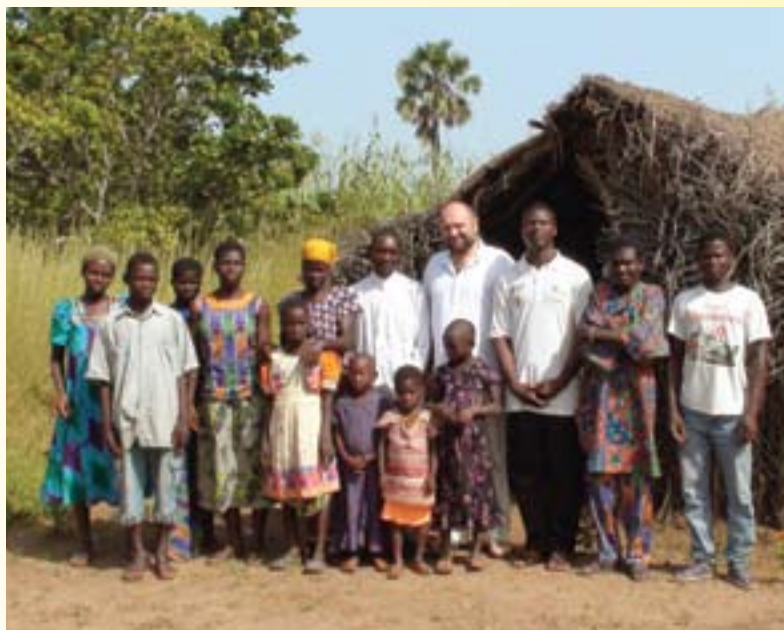
Egy ghánai család

hogy amikor szükségük lett volna rá, kiásták, de már tönkrement. E helyett mostanában igazi pénzt használnak, bár nagyon nehéz volt az átállítás, mert úgy tartották, hogy akiért ilyen pénzt adnak, abból nem lesz jó feleség. Hűtlen és erkölcstelen lesz, mert a pénz is kézről kézre jár... Ennek ellenére ma már általában ilyen a hozomány.