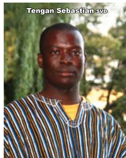
Tengan Sebastian svd