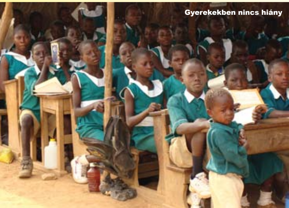
Gyerekekben nincs hiány

A személyes döntés a párválasztásban csak a fiúé vagy a lányé, de a szü-