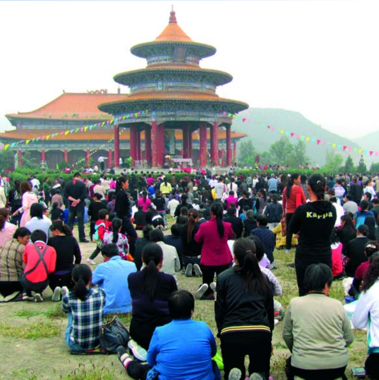
Fájdalmas Szűzanya-búcsú a Csi Ku San-hegyen

Tong Er Kou fontos missziós állomássá vált. Plébániája már kétszáz éves múltra tekint vissza. A falu melletti hegyoldalon katolikus gyermekotthon, papnevelde és kápolna is épült. A Tong Er Kou iránti érdeklődés egyre nőtt, és sokan ezt a helyet a Fájdalmas Szűzanya iránti tisztelettel kötötték össze. Ma az 1300 fős lakosság minden tagja katolikus.