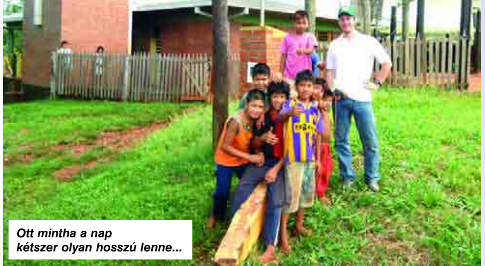
Ott mintha a nap kétszer olyan hosszú lenne...

Mit csináltam az elmúlt hónapokban? Épültem. Testileg és lelkileg. A jó táplálkozás segített egy-két kilót felszedni. Lelkileg: a sokszínű (és nem kétszínű) munka nagyon sokat segített. Az elején bánkódtam, hogy miért nem vagyok pap, mert akkor többet tudnék csinálni. De most visszavonom az akkori szavaimat. Rájöttem, hogy mindennek megvan az ideje. Papként nem lettek volna meg ezek a jó tapasztalataim, amiket kispapként volt szerencsém átélni. Dél-Amerikában a pap nagyon tisztelt és fontos személy. Ezért előtte nem mondanak trágár szavakat, meg a viselkedésük is más. Így kispapként át tudtam élni hétköznapi helyzeteket is. Kispapként egy nagyon fontos erényt tudtam elsajátítani: a türelmet. Mi, európaiak ezt kissé elfelejtettük