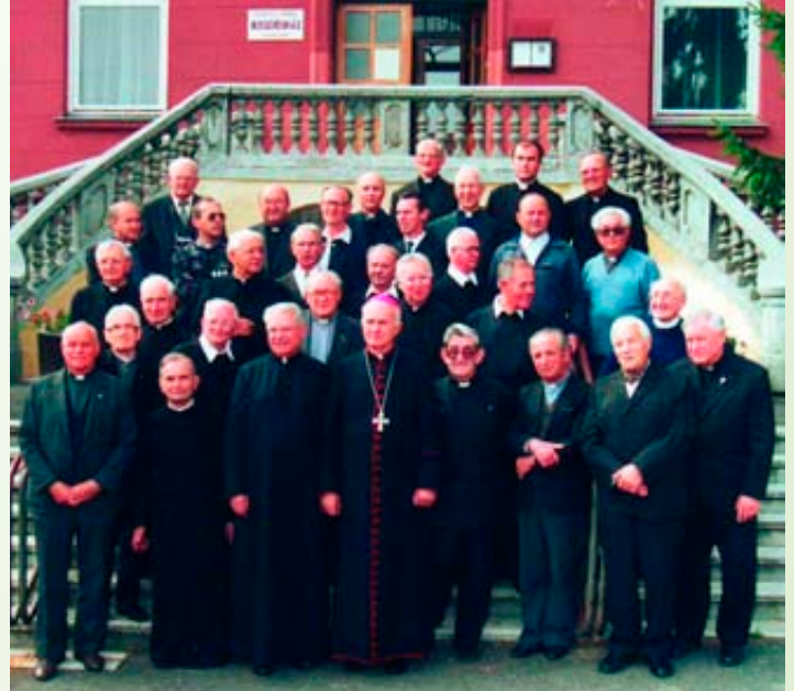
A visszatérés 1994-ben