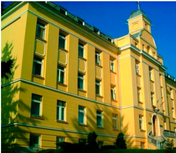
A missziósház napjainkban

pontosan rekonstruálhassuk, hány misszionárius atya és testvér került ki az intézmény falai közül hosszabb-rövidebb képzés után, hogy Magyarországon vagy a világ távo-