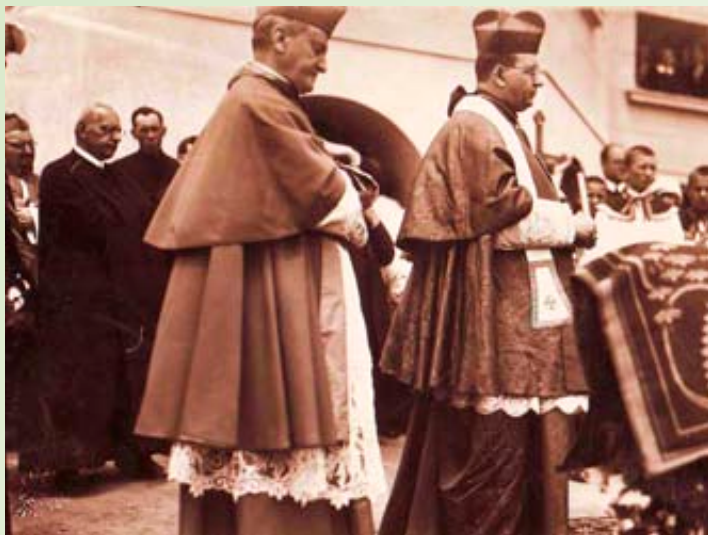
Serédi Jusztinián és Mikes János 1930-ban, a szenteléskor

Aki járt már Kőszegen, bizonyára tudja, milyen hatalmas a Jézus Szíve-plébániatemplom. Amikor azonban a város 1930. június 9-én, pünkösdhétfőn a Szent Imre-napot