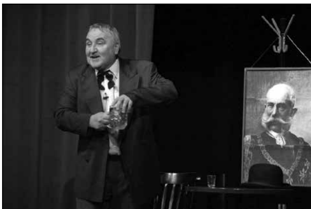
Saját produkciómmal, a Švejk vagyok című előadással 35 éve járom a világot

Az 1980-as, 1990-es években a Magyar Televízió sokat foglalkoztatott, több színházba hívtak vendégszerepelni, a film is megtalált, ugyan csak néhány alkotás erejéig ( Egészséges