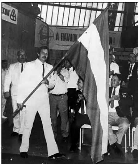
Megnyitó a budapesti vébén

FTC igazolt le. A klub vonzása nagy volt, a döntés hamar megszületett. Megnyílt előttem az az út, amelyiken a már akkor, fiatalon megfogalmazódott céljaimat elérhettem.