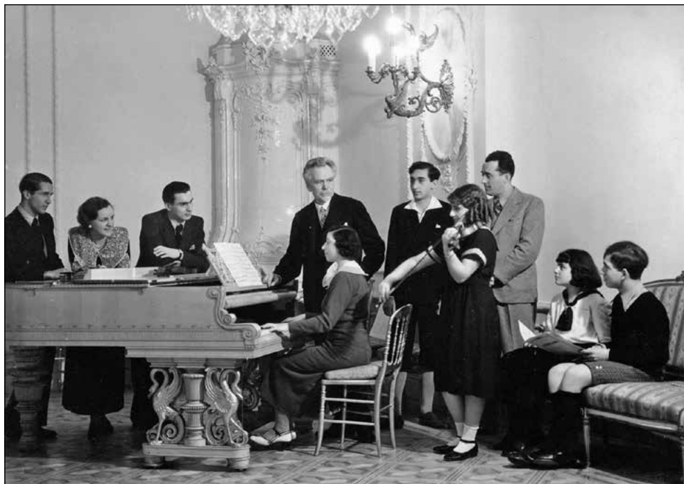
Hubay Jenő és tanítványai 1934-ben

francia Becsületrend, finn Fehér Rózsa-rend, a Kolozsvári Egyetem tiszteletbeli doktora, az MTA tiszteletbeli tagja, Corvin-lánc), és ő maga számos jelentős pozíciót töltött be életében. Már hazatérésének évében, 1886-ban megválasztották az Országos Dalárszövetség karnagyának Erkel Ferenc és Huber Károly utódként, majd – mint arra már utalás történt – tucatnyi szakmai és társadalmi szervezetnek lett a vezetője vagy vezetőségi tagja (Műbarátok Köre, Magyar Színpadi Szerzők Egyesülete, Magyar Zenepedagógusok Országos Egyesülete stb.). 1919-től 1934-ig a Zeneakadémia igazgatója (1925-től főigazgatója) volt, és ő képviselte az intézményt a parlament felsőházában.