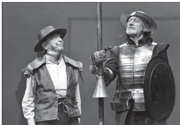
Miguel de Cervantes: Don Quijote – címszerep, Bodrogi Gyula (Sancho Panza) társaságában (Nemzeti Színház, 2015, rendező: Vidnyánszky Attila)

Tulajdonképpen ezzel a betegséggel akkoriban egyáltalán nem tudtak mit tenni. Természetesen mi sem tudtuk, hogy hogy kezeljük, hiszen egészen elképesztő mutatóványai voltak anyámnak. Például ilyen, hogy ott vagyok nála látogatóban, eldobja magát a földön, a gerincének egyetlenegy pontján áll, és rendkívüli energiával, hangoosan követeli az ő anyjától, hogy „Anyja, mi lesz az ebéd?” És a nagymama bejön: „Jaj, édes kislányom, mi baj?” „Mi lesz az ebéd?!” Nagyanym mondta, hogy „Bableves” – és akkor anyám fölpattant és rendbe jött. Csak engem akart mindig látni. Akkor már komoly kezelés alatt állt. Nem ismerték föl, hogy ez egy nyomelemhiánytól is van. Ma már sokkal jobban tudják kezelni a skizofréniát. Csak sokkolták őket, ez pedig egy rettenetesen durva módszer,