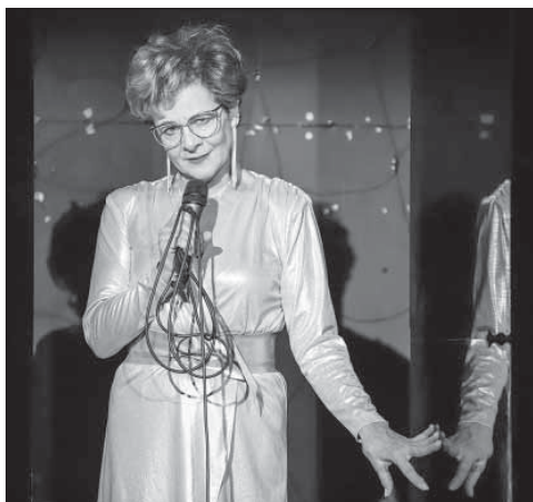
Ödön von Horváth: Kasimir és Karoline – az 'Énekes' szerepében (az előadaskép a Centrál Színház 2019. január 6-i bemutatóján készült)

Színésznő vagyok. Szín-Ész-Nő – remélem.