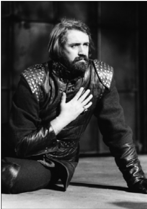
William Shakespeare: III. Richárd (József Attila Színház, 1983)

– A mindennapjaihoz, a színészmesterségéhez van-e valami vezérgondolata, amit követ, ami fontos, amihez ragaszkodik és ami megfogalmazható?