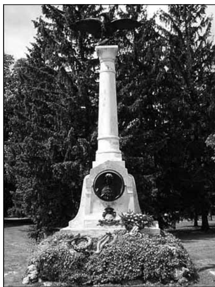
Zrínyi Miklós szobra Csáktornyan

Zrínyi-Frangepán (Wesselényi-féle) összeesküvés. A horvátok a Korbávia mezőn 1493-ban óriási vereséget szenvedtek a töröktől, és csak az