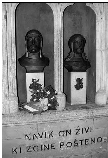
A két kivégzett hős mellékszobra a zágrábi székesegyházban, Örökké él, aki becsületesen hal meg felirattal 16

A két legjelentősebb horvát család története nemzeti tragédiának számított, hiszen a horvátoknál 1671 után már nem volt olyan befolyásos főúri család, amely az egész országban jelentős tényező lett volna, és amely képviselni tudta volna Horvátország érdekeit. Így az udvar kedvétől függött a horvátok alkotmányjogi helyzete, amely kisebb engedélyekkel függővé tette a horvátokat. Ugyanakkor elvesztek a Zrínyiek és Frangepánok hatalmas birtokai is, mert átszálltak a bécsi udvarra. A katonai