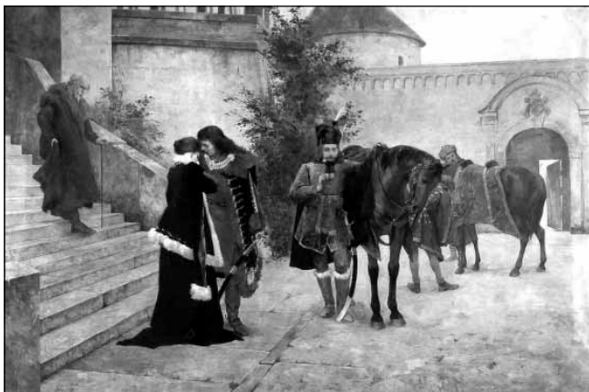
Zrínyi Péter és Katalin búcsúja

„Április 28-án reggel 8 órakor vallatni kezdték Zrínyi Pétert bűntársairól, és ezt délig folytatták. Zrínyi gróf többször sírva fakadt, és gondosan feljegyezte a