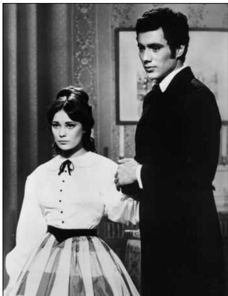
Kovács Istvánnal a Kárpáthy Zoltán című filmben (1966, rend.: Várkonyi Zoltán)

Erre nincs recept, mert mindenkinek más a környezete, a háttere. Végül is mindenkinek a saját életében kell ezt kikísérletezni, megtapasztalni. Volt az életemben olyan korszak, amikor nagyon sokat dolgoztam, valószínűleg az is adott számos tapasztalatot. Volt, amikor kevesebbet, az megint más módon telt. Minden embernek a saját ritmusa és életformája szerint kell ezt kitapasztalnia. Mert mindenki máskor tanul, mindenki máskor fogékonyabb. Van, aki próbálni szeret inkább, van, aki otthon szeret leülni, úgy tanul. Annyira más minden ember, így változó az is, kinek mi jó. Van, aki sűgővel pillanatok alatt megtanulja a szöveget, van, aki a próbán rögzíti. Ki kell tapasztalnia saját magát, saját magának.