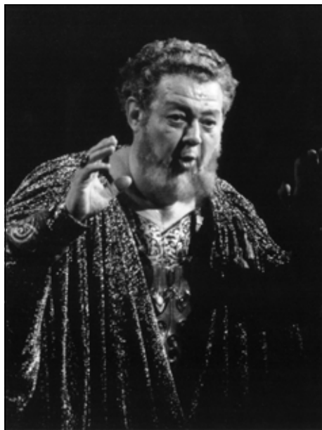
Richard Strauss: Salome , Heródes szerepében

Három szezont (az akkor még Nyugat-)Németországban csak kitágította és rányomta bélyegét a művészi munkámra.