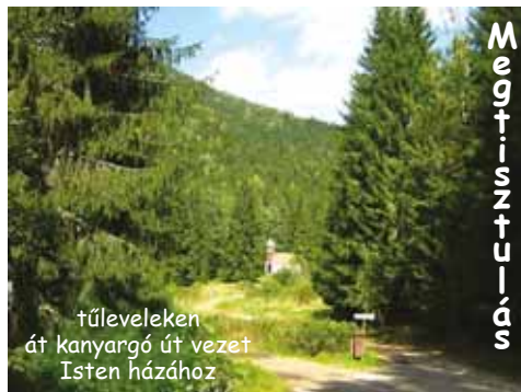
tűleveleken át kanyargó út vezet Isten házához