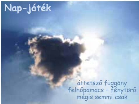
áttetsző függöny felhőpamacs - fénytörő mégis semmi csak