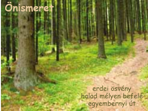
erdei ösvény halad mélyen befelé egyembernyi út