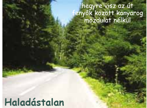
hegyre visz az út fenyők között kanyarog mozdulat nélkül