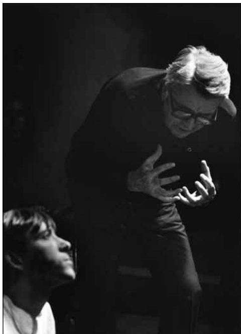
Fábry Zoltán filmrendező

Nemcsak nekem, hanem sok korombéli fotográfusnak is. Akik már