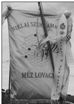
A Niklai Szent Ambrus Méz Lovagrend zászlója