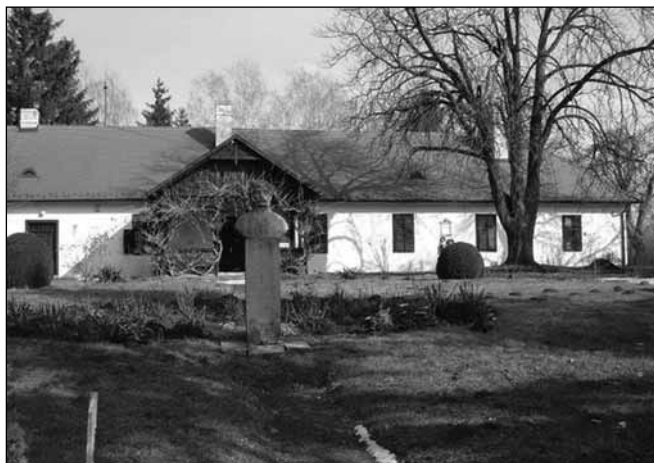
A Berzsényi-emlékház, a költő sírja és mellszobra