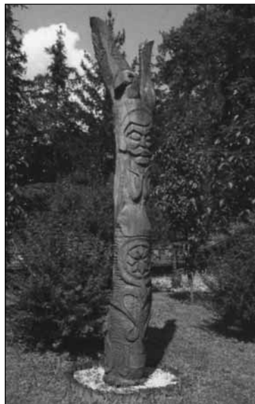
Római katolikus templom Berzsenyi-emlékoszlop (Berkesi Gyula alkotása)