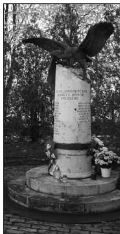
Háborús emlékmű (Szanyi Tibor alkotása)