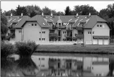
Lakópark a látványtó partján