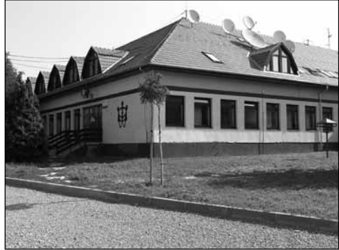
Janikovszky Éva Általános Művelődési Központ