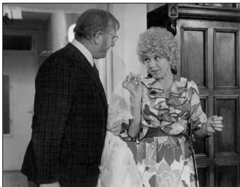
SZERELEM JUTÁNYOS ÁRON