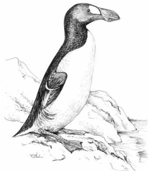
ÓRIÁS ALKA KIPUSZTULT 1844-BEN (PÁL JÁNOS RAJZA)

kezdődött. Jelen állapotában inkább az Ítélet Napjára, Armageddon idejére emlékeztet – hisz jusztt se akar bekövetkezni –, semmint rokonaira, a Föld Napjára, a Madarak és fák napjára, vagy épp a nők napjára. Valentinnak sikerült. A szerelem él, a természet halott. Tizenhat éve, jaj, tizenhat éve immár, hogy foglalkoztat ez a kudarc.