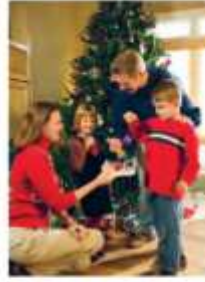
▲ Karácsonyfa-állítás: európai keresztény hagyomány

Családi ünnepi szokásainkat meghatározhatja az is, milyen valláshoz vagy népcsoporthoz, nemzetiséghez tartozunk. Gondoljatok csak a karácsonyra vagy a húsvétra! Vannak családok, akik karácsonykor Jézus születését vagy az angyalkát, vannak, akik a fenyő vagy a szeretet ünnepét várják. Húsvét a keresztény közösségeknek a feltámadás ünnepe, mások a himes tojás, a nyuszi vagy a locsolkodás hagyományait őrzik. Azok a családok, amelyekben a szülők különböző nemzetből származnak, mindkét kultúra szokásait megtarthatják.