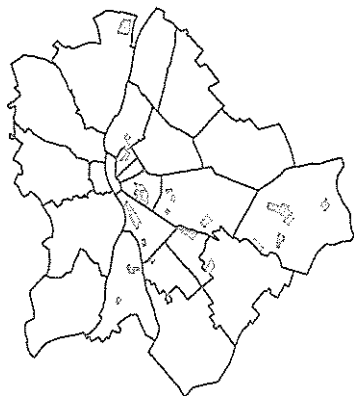
10. melléklet: Krízisterületek a fővárosban, 2008. Forrás: Csanádi et al. 2009: 35.

Forrás: http://www.utvonalterv.hu/Print.ashx?SessionID=99191_1174831_5134837