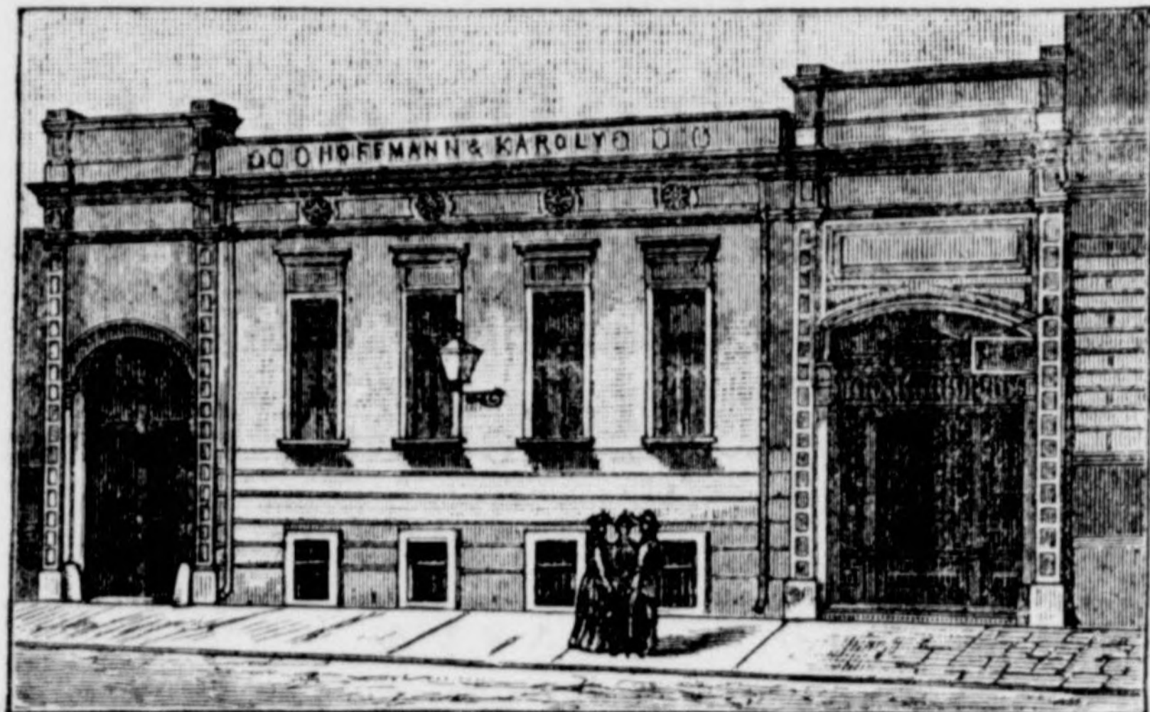
óposta-utca 14. szám.

készít és szállít az épület- és butor-szakmába vágó mindenemű fa-munkákat a legjobb minőségű anyagból, állandó, gyakorlott munkásokkal és a legjobb gépekkel.