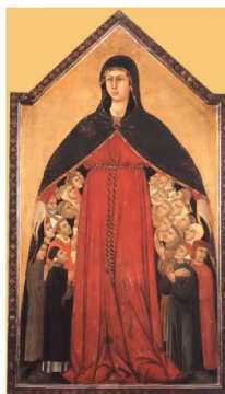
Mária, az egyház anyja

Aktiválja a Windowst Aktiválja a Windows rendszert a Gépén