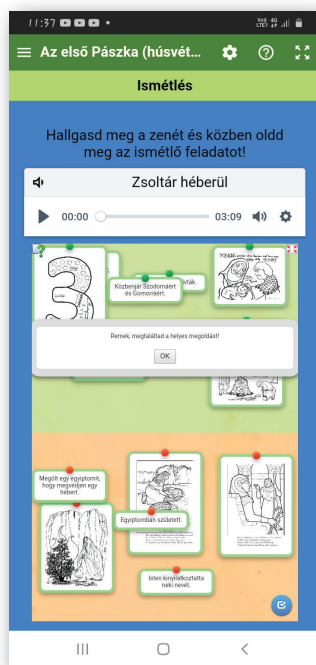
Egy diák által visszaküldött kép a megoldott feladatokról

Egyéni tanulásnál nagyon jó a program, mert a megjelenése alkalmazkodik a felhasználó eszközehez. Így jól látható laptopon, de tableten és okostelefonon is megfelelő méretű még a szöveg is.