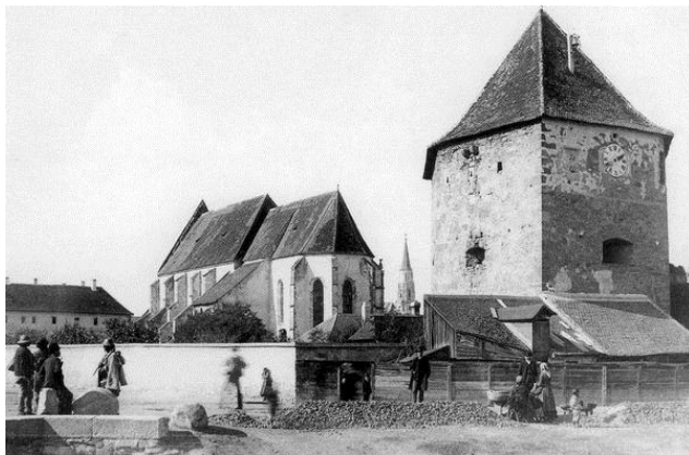
9. A Farkas utcai templom és a Kollégium a Tordai út felől a XIX. század végén

felbontotta hogyan az tornáztatást. egy állandó