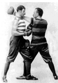
12. Vermes boxmeccsen (jobb oldali)

Természetesen a baklövessel fejeződött be, mivel