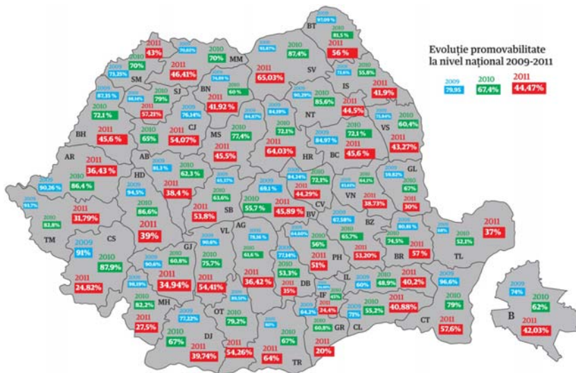
Románia térképe megyei adatokkal / 2009–2010–2011

Romániában a sikeres érettségi vizsgát tevők aránya 2009-ben mintegy 80% volt (79,95%), egy évvel később, 2010-ben ez az arány lecsökkent 67,4%-ra. Ez a csökkenés annak tulajdonítható, hogy kivették az érettségi tantárgyak közül a tornát, és a szóbeli nyelvvizsgákon a diákok nem jegyet, hanem csak minősítést kaptak, így az átlag durván 15%-kal csökkent. 2011-ben felszerelték a kamerákat. A számok magukért beszélnek. 44,47% ! Ha megfigyeljük, van egy-két megye, ahol az arány még mindig kiugróan magas (pl. Hargita 64%, Suceava 65%).