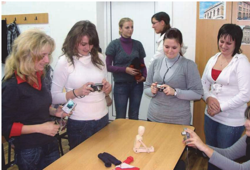
A hallgatók is rendszeresen fotóznak a tevékenységeken

Megítélésem szerint a legfontosabb feladat itt az ismeretek elsajátítása mellett a tantárgy, a kreatív, kísérletező, aktivizáló tanítási mód megszerettetése. Rá kell vezetni már kezdetben a hallgatókat arra, hogy minden ember, tehát ők is tehetségesek, kreatívak, képesek szép, hasznos dolgokat létrehozni, hogy a későbbiekben ugyanerről meggyőzhessék tanítványaikat is. Ez tapasztalataim szerint csak könnyű, gyors, mutatós eredményeket biztosító feladatok kijelölésével, beindításával lehetséges, és persze tengernyi biztatással, dicsérettel, ösztönzéssel, példamutatással.