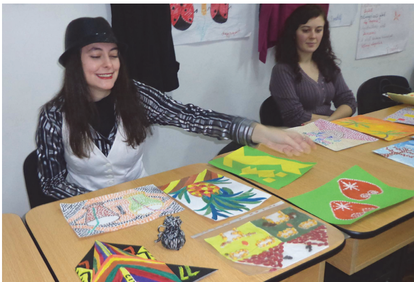
Vizsga képzőművészeti nevelésből

Már régen írom, publikálom, népszerűsítom módszertani elképzeléseimet, gondjaimat azzal a reménnyel, hogy talán valaki egyszer csatlakozik hozzám, segítőkéz kezet nyújt, kiegészíti, gazdagítja, kijavítja, helyes mederbe tereli gondolataimat, elképzeléseimet. Bevallom, még az is átfutott az agyamon, hogy valamilyen tanügyért felelős intézmény mellém áll, kiadja a módszertani írásaimat vagy sokszorosíttatja, esetleg lefordíttatja románra azt a szemléltetőim tartalmazó DVD-t, amely nagyon sok kolléga, tanár, óvó- és tanítónő munkáját segítené. Mindez azonban alig érdekel valakit. Eddig még nem talákoztam olyan emberrel, aki vállalná, hogy átnézi, véleményezi ezt a hatalmas anyagot, szerintem azok is kevesen lehetnek, akik érdemben hozzá tudnának szólni.