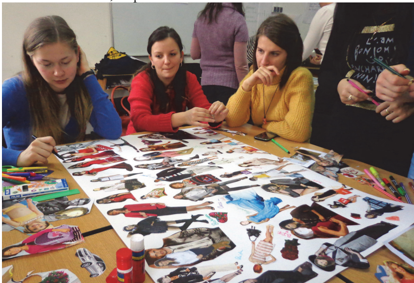
Csoportos feladat kollázs-technikával

Egy tantárgy, tevékenységi terület szeretetét, a hitet annak fontosságában, létjogosultságában nem lehet mímelni, eljátszani, esélytelen, pályatévesztett az a pedagógus, aki hasonlókkal próbálkozik. Ezért bűn a leendő nevelőket olyan oktatók kezére adni, akik maguk sem hisznek tevékenységük létjogosultságában, eredményességében, nélkülözhetetlenségében. Kreativitásról, kezdeményezőképességről, dinamizmusról, alkalmazkodóképességről csak az a pedagógus beszélhet, aki maga is hasonlóan gondolkodik, cselekszik, él. Közhelynek tűnő alapigazságok ezek, mondhatnánk, ha az élet nem figyelmeztetne nap mint nap arra, hogy nagyon sokan még közhely szinten sincsenek tisztában ezekkel az elvárásokkal, alapelvekkel.