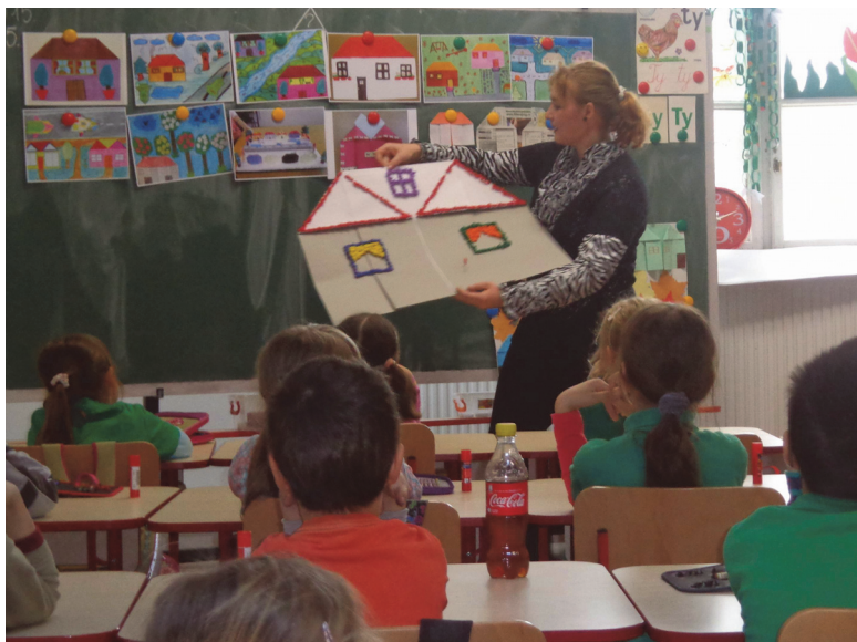
Gyakorló tanítás az első osztályban

Többek között az, ha a kezdetektől hozzászoktatjuk a hallgatókat ahhoz, hogy a tanultakat minél szélesebb körben használják fel a különböző tevékenységeken, tantárgyak keretében. Például hajtogatunk néhány egyszerű tárgyat: poharat, házat, papírdobozt, és azt kérjük szemináriumi feladatként, hogy legközelebb ezek felhasználási módjait mutassák be a matematika, irodalom, földrajz, történelem, hitoktatás területén. Természetesen itt sem szabad magukra hagyni a hallgatókat, egy-egy ilyen elvárást minden esetben számtalan példa bemutatása előzi meg. Az ünnepvárók, folyosó- és osztálydíszítések, ajándéktárgyak készítése alkalmával a képzőművészeti és kézműves ismeretek előtérbe kerülnek. A mi feladatunk az, hogy minden adandó alkalommal – beleértve a szemléltető készítését is – külön utaljunk ezekre a lehetőségekre. A tevékenységeink nem úgy fognak felértékelődni, hogy az illetékesek megsokszorozzák az óraszámot – bár ez is indokolt lenne, hiszen akkor legalább összegyűlne egy-egy katedrányi óra az iskolákban –, hanem úgy, hogy a képzőművészeti, kézműves kreatív játékok szerepe egyre nagyobb teret hódítson az iskolai és iskolán kívüli tevékenységeken, óvodai, valamint elemi és általános iskolai szinten.