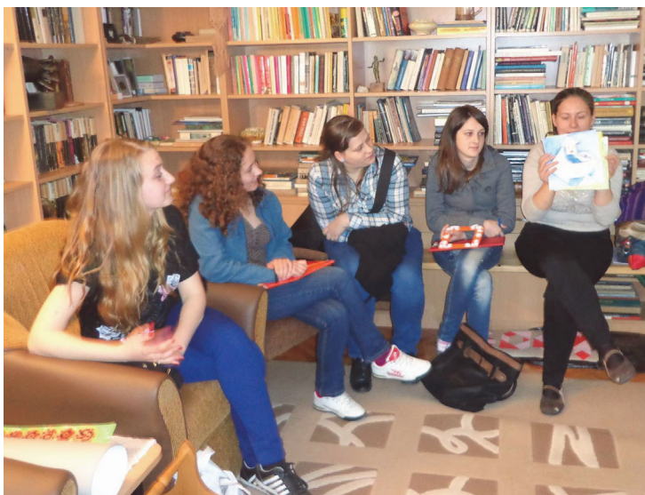
Szemináriumi bemutató a tanár lakásán

legyen gondunk arra, hogy a hallgatók helyesen használják a legfontosabb eszközöket, technikákat, szakkifejezéseket. Mutassunk minél több gyerekrajzot, elsősorban a saját tanítványaink munkáit, hiszen ezekkel hitelesíthetjük elvárásainkat. Ne csak a gyakorló iskolákban tanító kollégáktól várjuk el, hogy órákat tartsanak, hanem tartsunk olykor mi is ilyeneket. Állandó munkahelyemen régebben e miatt vállaltam órákat I–IV. osztályban is. Kézzelfogható, konkrét példákkal utaljunk arra, hogyan lehet ösztönző, aktivizáló módon szemléltetni, vonjuk be a hallgatókat csoportos tevékenységekbe, utaljunk minden adandó alkalommal a tantárgyakon átívelő felhasználási lehetőségekre, tanítsunk technikákat, ismertessünk meg minél több anyagot, módszert. Kézművességből ismerjünk meg minél több természetes, mesterséges és újrahasznosítható anyagot, valamint ezek kreatív alakítási, felhasználási, alkalmazási, kombinálási lehetőségeit, tanítsunk origamit, tangramot, szemléltessük ezek széleskörű felhasználási lehetőségeit. A fentiekén kívül a szatmáriak számára vizsgaanyag a tájékozódás annak a könyvészetben is szereplő DVD-nek az anyagában, amelyeket már az első kurzuson kézhez kapnak.