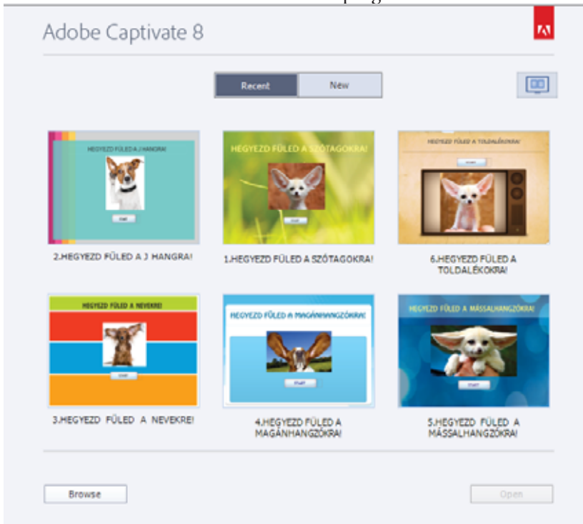
1. ábra: Választható modulok. Az oktató program kezdő oldala

Az oktatóprogram moduljait egy-egy kutyafajta jelképezi. A gyakorló gyermeknek mindig egy bizonyos feladattípusra kell hegyeznie a fülét (Hegyezd a füled a nevekre! Hegyezd a füled a magánhangzókra! stb). Miután a gyermek megoldott egy feladatot, rögtön visszajelzést kap: helyes megoldás esetében mosolygó arcot, mert sikeresen elvégezte a feladatát; helytelen megoldás estében nem kap büntetést, szomorú arc sem jelzi a sikertelenséget, a program viszont azonnal egy új feladatot generál. A modul végén a tanuló teljes képet kap a munkájáról: a játék utolsó ablaka tartalmazza a százalékos teljesítményt, megmutatja, hogy hány feladatot oldott meg helyesen, hányat hibásan. Ezek után a tanulók ellenőrizhetik a megoldásaikat, mert az ezt jelző gombra kattintva a program végigvezeti őket a feladatokon, ahol a helyes megoldások mellett a téves megoldások helyes változata is megjelenik. A program minden újrajátszás esetén újragenerálja a válaszok sorrendjét, így a gyakorlás nem válik unalmassá.