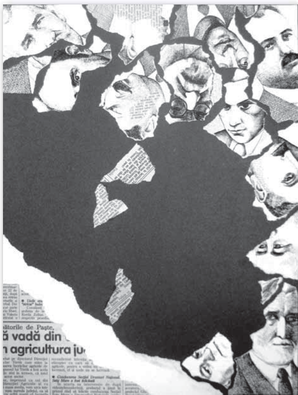
3. Búcsú a XX. századtól (2000, vegyes technika)

Az ezredfordulós éveket nemcsak a gyökeres politikai, társadalmi átalatulások jellemezték, hanem alapvetően megváltozott, folyamatosan átalakult a kommunikáció módja is. Ez kihat a kultúránkra, a művészi közlésmódra is. Megítélésem szerint, aki lépést szeretne tartani a világban zajló folyamatokkal, rákényszerül a váltásra. Erőteljesen vizualizálódó világban élünk, amin nincs mit csodálkozni, mert az emberiség kultúrája mindig vizuális volt és marad. Ezt hiba lenne összekeverni, egybemosni a természetelvű megjelenítésekkel, hiszen a jelenség ennél sokkal árnyaltabb és lényegesen több.