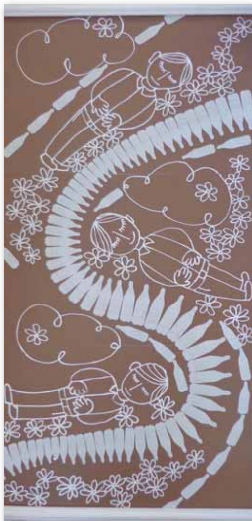
4. Jelenet Az élet szép sorozatból

Azon sincs mit csodálkozni, hogy a technikai, információs forradalmaknak köszönhetően a képzőművészet újra közkinccsé, a szó szoros és tágabb értelmében köztulajdonná válik. Ilyen körülmények között magától értetődő módon felértékelődik a kulturális, társadalmi szerepe, és ezzel lassan, de feltartóztathatatlanul elhomályosul az egyéni teljesítmények jelentősége. Tévedés ne essék, a nagy egyéniségek a továbbiakban is nélkülözhetetlenek; a szerepkörük, ismertségük módosul. Az általuk képviselt értékek, erények nem tucatszámú kiválasztott, széles körben elismert művész privilégiuma lesz, hanem olyan általános társadalmi tendencia, amelynek ők az éllovasai, és amellyel viszonylag rövid idő alatt milliók tudnak azonosulni.