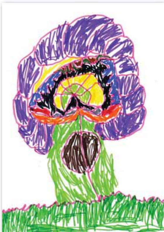
1. Mesefa (4 éves gyermek rajza)

Nem tudjuk egészen pontosan, hogy merre található az istenek játszótere. Kultúrtörténetünk ilyen szempontból megtévesztő: több helyszínt nevez meg. Lehet, hogy az Olümposzon zajlik, a Valhalla, az arany Róma, Asgard, Teotihuacan is remek helyszínek lehetnek, a néphiedelem által szent helyeknek hitt Szeged környéki bodzacserjéről nem is beszélve. Számunkra a legvonzóbbnak, legizgalmasabbnak mégis a Mennyegek Országá tűnik, ahol az üdvözült lelkek minden valószínűség szerint gyakran és sokat játszanak. Biztosan így van, hiszen lazítás nélkül az örökkévalóság is egysíkúnak, unalmasnak tűnik.