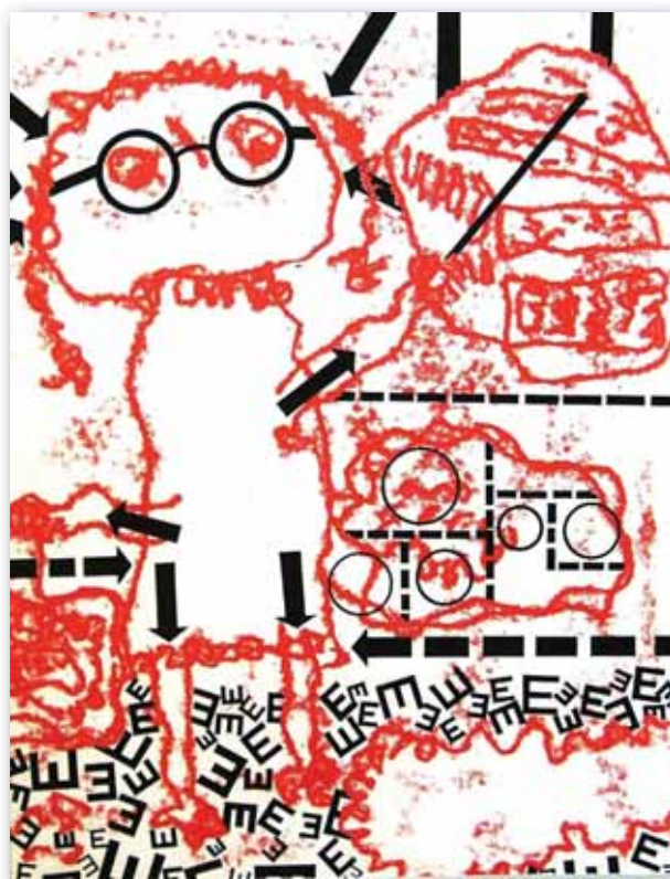
2. Szemüveges (monotípia, tus; 1983)

széket a műkritika, műértelmezés helyéről, szerepéről; kismonográfiákat, tárlatkrónikákat, kritikákat. S minél jobban belemeredtem mindezek tanulmányozásba, annál távolabb kerültem a lényegtől.