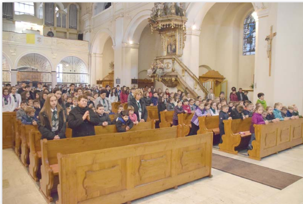
A 2018. november 5-i iskolabúcsún

– Mindaközben, hogy igazgatóként – „nem középiskolás fokon” – teszed a dolgodat, egyetlen tanítasz és kutatsz, s még mindig tárgyalásokra jársz, ugyanolyan lendülettel viszed tovább annak a vetélkedőnek a szervezését, amit még igazgatóvá válásod előtt kezdél el: a Kreativitás vetélkedő nagyon sok diákot (és tanárt) szólít meg a katolikus egyházban, de annak berkein kívülről is. Hiánypótló és egyre népszerűbb ez a program. Kérlek, beszélj róla!