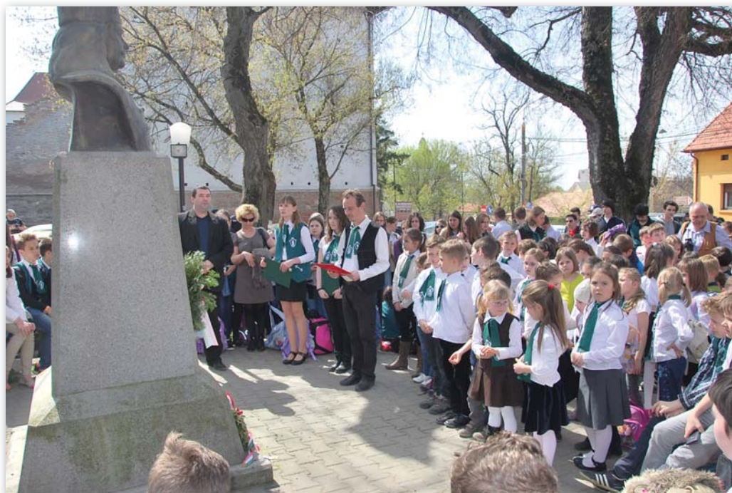
Az iskola névadója szobrának koszorúzási ünnepségén 2016-ban