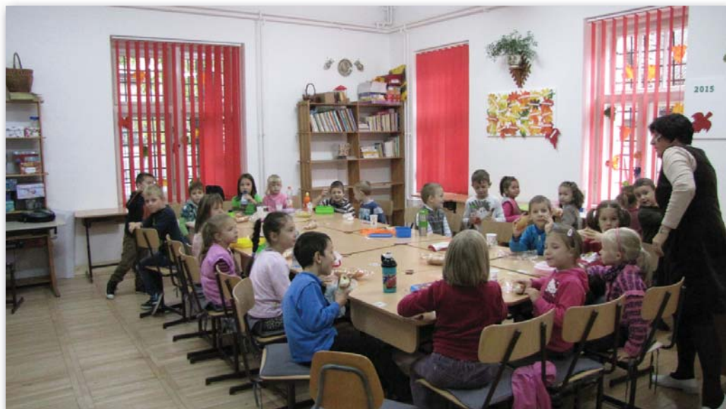
Jól felszerelt osztályokban tanulnak a gyerekek

– Egyedi kell legyen abban, hogy aki ide belép, érezze, valami egészen jó helyen jár. Ahová a gyerek mosolyogva jön, és a mosoly az arcán van akkor is, amikor hazaindul. Olyannak szeretném ezt az iskolát, ahol tudunk annyira bízni egymásban, hogy megbeszéljük mindazt, ami bánt bennünket, és egymásra figyelve építhetünk egy olyan, minőségi oktatásra lehetőséget adó környezetet, amelyben senki sem azt érzi, hogy „kihajtják belőle a lelket”. Olyannak szeretném ezt az iskolát, ahol nem kell leosztani a feladatokat, hanem magunktól vesszük észre, hol tudunk egymásnak segíteni. Úgy érzem, ezen az úton haladunk.