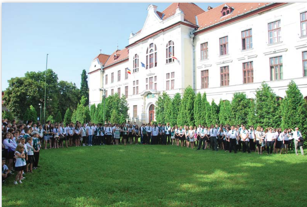
A 2015–2016-os első tanév záróünnepsége

– Úgy gondolom, sokan várták már, hogy legyen újra katolikus iskola. Én is meglepődtem, amikor azt láttam, hogy az előkészítő osztály úgy telt fel, hogy a szülők még azt sem tudták, hogy hol lesz az osztályterem, s ki lesz a tanítónő. Az ötödik osztályba akkora volt a túljelentkezés, hogy felvételi vizsgát kellett szervezni. A líceumi osztályok is maximális létszámmal teltek fel. S ezek csak a cikluskezdő osztályok. Érezhető volt az érkező diákokon, a szüleiken, hogy kell nekik ez az iskola, s részt akarnak vállalni a működtetésében. S ez a későbbiekben tapasztalt kiállást is magyarázza. Mindenki, aki ide érkezett, a sajátjának érezte ezt a közösségi teret, ezt az iskolát.