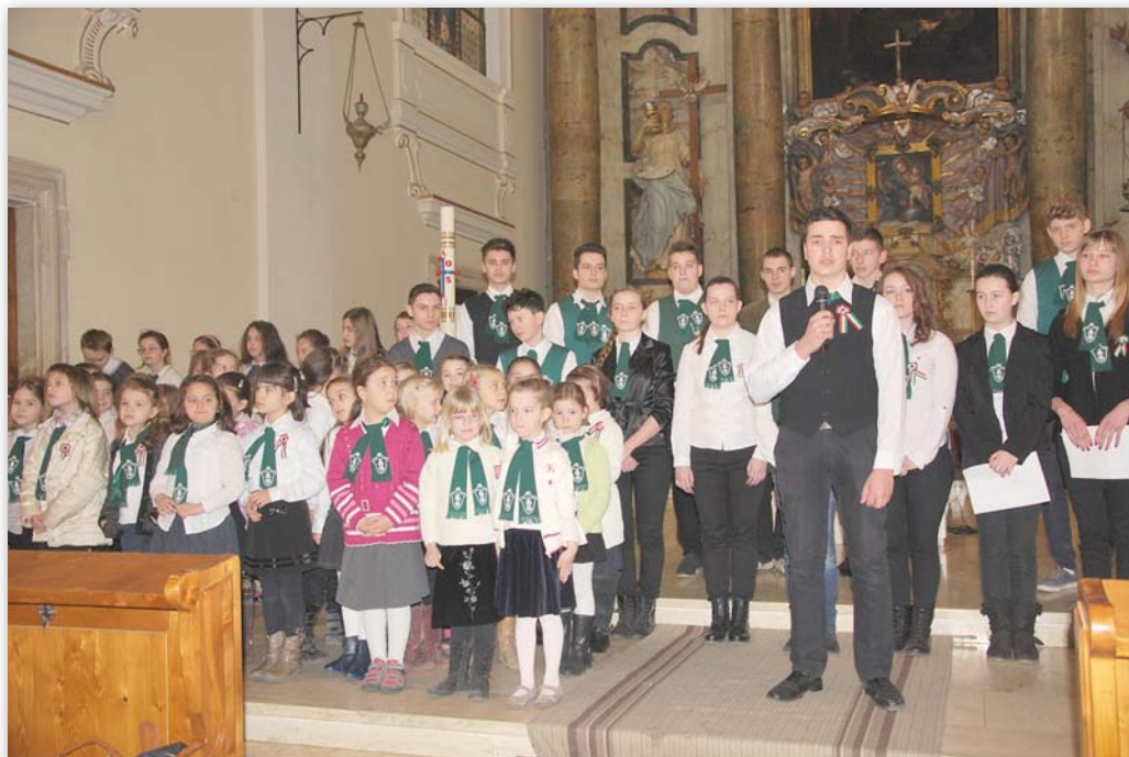
Március 15-i ünnepség 2016-ban a Keresztelő Szent János templomban

– Az emberpróbáló meghurcoltatás idején mi adott erőt?