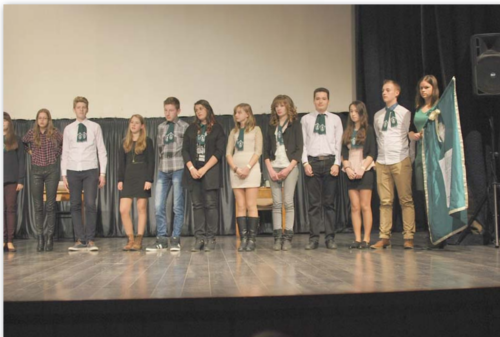
A 2015–16-os tanév gólyabálján készült kép

– Erről nagyon sokat lehetne mesélni. Amikor azon, a számomra emlékezetes novemberi estén közölték, hogy másnapról nem mehetek be az iskolába (másnap reggel éppen az iskola Szent Imre búcsús miséje volt, s a következő héten a gólyabál), nem hittem el, hogy jól értem a közleményt. Aztán rájöttem, hogy jól értem. Az első napokban otthoni magányomban nem tudtam elképzelni, hogyan éli ezt meg a közösség. A közösségi oldalakon láttam, hogy egy hihetetlen összefogás vette kezdetét. De a média nem tudta pótolni a személyes találkozást. Amikor végül decemberben megengedték, hogy négy órára bemehessek az iskolába a fizetések utalását aláírni, személyesen láttam, hogyan ragált a közösség. Szinte egy órán át csak a kollégák köszönését, ölelését viszonztam. (Amikor elindultunk az iskolából, az engem kísérő hatóságai személy – átvéve a hangulatot – szintén megölelte a személyzetet...). És a kisdíjak az igazgatói iroda előtt előre hozott karácsonyi kántálással kívántak boldog ünnepet. Majd a karácsonyfa alá megérkezett a cipősdoboznyi, kis cetlikre írt jókívánság. Közben a kollégák megtanulták, hogyan hívható össze igazgató nélkül az iskolaszék, ilyen helyzetben hogyan lehet továbblépni és tervezni. S a közösség formálódott, erősödött, hihetetlen, csodás módon. És nem csak az iskolában. Ez „ügy” lett. Nem felszínesen, hanem valóban. Mindig beleborzongok, amikor visszagondolok erre. Mert egy ilyen közösség élen állni újra nagy felelősség és jóval nagyobb kihívás.