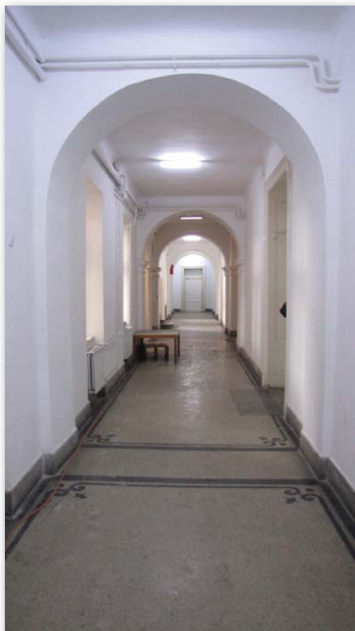
A 2015–2016-os tanévet már a részben felújított iskolában járták a diákok

A munkálatok egész nyáron folytak, éppen hogy elkészültünk a tanévkezdésig. Párhuzamosan a teljes felszerelést is be kellett szerezni, hiszen az egyház csak az ingatlant kapta vissza, az abban egykor volt leltári tárgyak közül semmit. Így gyakorlatilag a nulláról kellett felszerelni az iskolát padokkal, székekkel, bútorzattal, számítógépekkel, fénymásolókkal s minden, az oktatáshoz szükséges eszközzel. Itt tapasztaltam meg nagyon erőteljesen, hogy az újraindulás mennyire erős közösségi akarat. Azon túl, hogy folyamatosan voltak önkéntesek, akik ha kellett cipeltek, a cipelnivaló is összejött. Alapítványok, felajánlások, pályázatok segítségével sikerült teljesen felszerelni az iskolát, s ez a felszerelés azóta is folyamatosan bővül. Sokaknak fel sem tűnik talán, de a semmiből 2015 őszére egy részben felújított és szinte teljesen felszerelt iskola nyithatta meg a kapuit ott, ahol 11 évvel korábban még csak egy teológiai osztályt sem voltak hajlandóak befogadni.