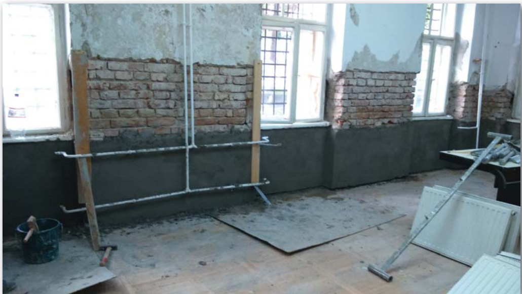
A lelakva visszakapott épületszárny teljes felújításra szorult

– Az átköltözés 2015 nyarán kezdődött el. Valójában a cikluskezdő osztályaink már a régi kollégiumi épületszárnyban indulhattak, a katolikus osztályokból a korábban beiskolázott diákok „kimenő” osztályonként a Bolyaiban maradtak. Úgy terveztük, hogy négy osztály indul ebben a épületszárnyban (előkészítő, ötödik és 2 kilencedik), viszont közben kiderült, hogy átkérte magát a katolikus iskolába az Egyesülés Főgimnázium elemi és gimnáziumi magyar tagozata, ami további 6 osztályt jelentett. Ezek mind a kollé-