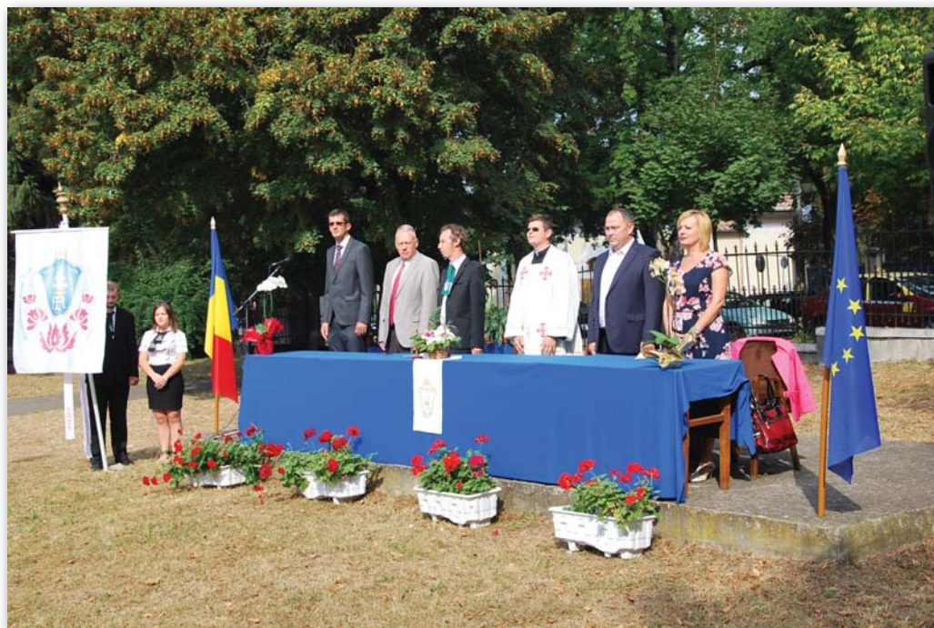
A 2016–2017-es tanévnyitó prezídiuma

– A versenyképességhez elsősorban versenyképes diákok és magas szintű képzést nyújtó kollégák kellene. És természetesen kell az az önként vállalt plusz munka, amely lehetővé teszi a felkészülést. A tanári karunk erre nyitott, és folyamatosan voltak és vannak olyan diákjaink, akikkel lehet jelentős eredményeket elérni. Ebben a folyamatban én csak azt kell(ett) kövessem, hogy milyen háttér szükséges a versenyképes felkészüléshez.