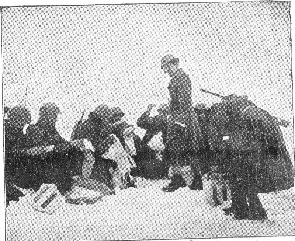
Az albán hegyekben harcoló olasz katonák meleg ruhaneműt kaptak ajándékba karácsonyra