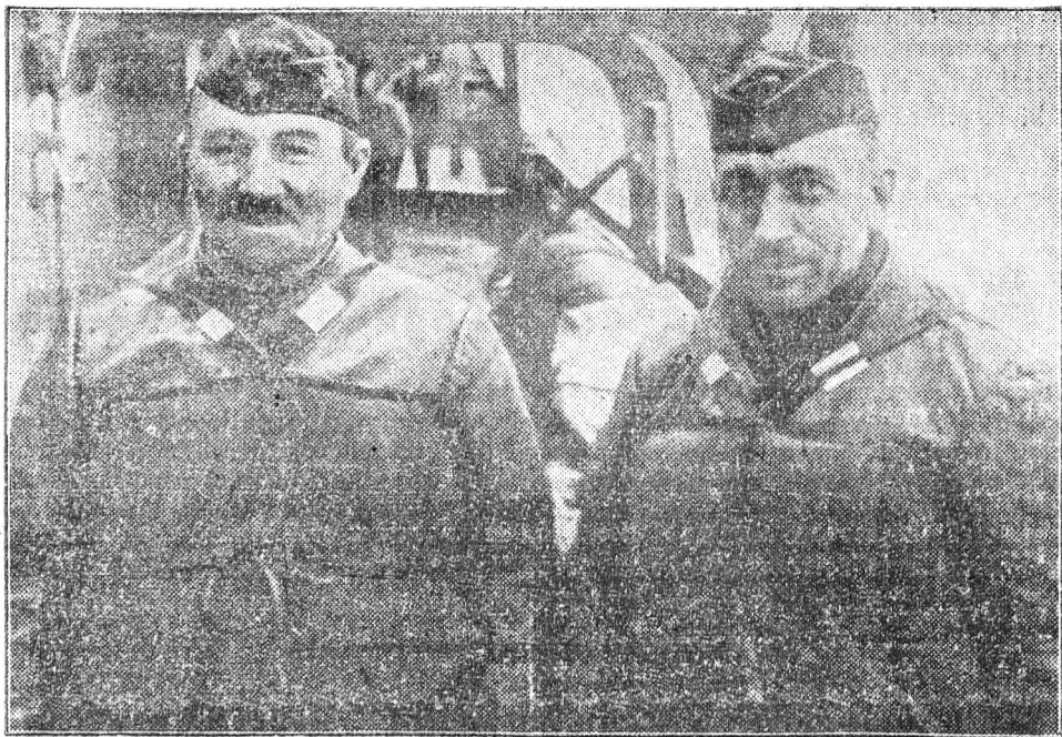
Egy német őrhajó két matrőca. Mindkettőn egy kis porosz halászfaluból származnak, már az elmúlt világháborút is végigküzdötték és most tengeri kalandjaik, hosszú tapasztalataik folytán, valóságos példaképei fiatalabb matrőz-bajtársaiknak