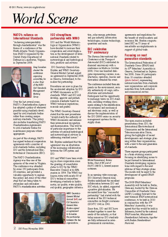
2. ábra. Rövid hír az ISO Focus 2008. novemberi számában az ISO és a WMO közötti együttműködési megállapodásról (ISO Focus, 2008).

A meteorológiai szolgáltatók által bevezetett minőségirányítási rendszerek alapot biztosítanak a termék- és szolgáltatáscsomagok kidolgozásához és bővítéséhez. Felismerték ugyanis, hogy a repülésmeteorológiai szolgáltatásokon kívül más tevékenységi területeken is érdemes és hasznos működtetni a MIR-t. Ezt a tanúsítási terület bővítést segíti a XVI. Meteorológiai Világkongresszus által jóváhagyott WMO Szolgáltatásnyújtási Stratégia is. A WMO egyébiránt ösztönzi a tagjait, hogy a tevékenységi területükre szabott