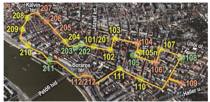
2. ábra: A 2016. nyári mérések útvonalát 23 mérési ponttal. A parkosabb zöldterületeken található mérési pontokat világoszöld számmal jelöltük (a növényzet aránya a mérőpont környezetében átlagosan 50%-os), a szorosabban beépített területek, illetve a forgalmas közlekedési csomópontok mérési pontjait narancssárgával (a növényzet aránya jellemzően nem éri el a 10%-ot). A sárga számmal jelzett mérési pontok arra utalnak, hogy a (gyakran) szélesebb út mentén fasor, jelentősebb zöldfelület is fellelhető.

Külön elemzéseket végeztünk a kijelölt útvonalon végzett mérések alapján (Incze, 2017), ahol természetesen a mérési körök bejárásához szükséges idő (mely nagyjából 2–2,5 óra) miatt nem folyamatosak a hőmérsékleti és nedvességi idősorok, viszont a beépítettségtől és növényzettől függő területi különbségek így értékelhetők. A vizsgálat másik része a fix mérési helyszínen folyamatosan rögzített idősorok elemzése (Kurcsics, 2017), ahol