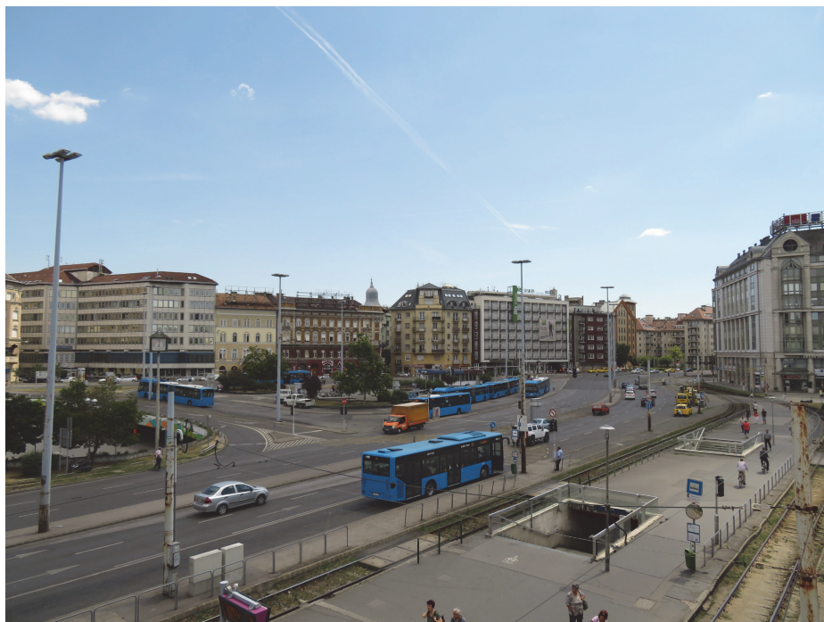
5. ábra: A 112=212. mérési helyszín a Petőfi híd pesti hídfőjénél található a Boráros téren: nagy közúti forgalommal jellemezhető tömegközlekedési csomópont, ami egyik oldalon kb. 30 m magas lakó- és irodaházakkal szegélyezett nyitott tér – alapvetően mesterséges burkolattal, kisebb területeken fűvel, bokrokkal borítva, s előfordul néhány lombhullató fa is.

rendeztük be a fix mérési helyszínt, mely a 2016. nyár végére felújított Ferenc tér közelében található. A kijelölt mérési pont mind a négy oldalról viszonylag magas, hatszintes épületekkel van körülvéve, s csupán két átjáró vezet be rá; ezért a szélről viszonylag védett. A sétány nagyobb részét beton, térkő fedi, egy kisebb része viszont parkosított, fűvel borított rész néhány nagyobb fával (3. ábra). A házak között megrekedhet a levegő, ugyanakkor a parkosított rész erre hűtő hatást gyakorol-