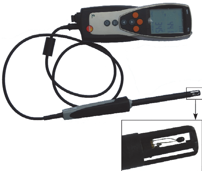
1. ábra: A 2016-tól alkalmazott, adatgyűjtő egységgel is rendelkező Testo-623 típusú műszer

indulásakor kijelölt körbeérő gyalogos útvonal (2. ábra) mentén 22 mérőpontot határoztunk meg (Dian et al., 2015), melyek száma egy-egy évszak tapasztalatainak figyelembevételével 2016 őszére 24-re bővült. A mérőpontok kiválasztásánál fontos szempont volt a nagyjából egyenletes elhelyezkedés, továbbá az, hogy az egyes pontok összességében megfelelően reprezentálják a térség különböző beépítettségi viszonyait: így épületekkel jobban körülvett utcák és nagyrészt nyíltabb, zöld növények alkotta kisebb parkok is megtalálhatók közöttük. 2017 nyár végéig 65 napon történt mérés, mindösszesen 709 órányi időszokról. A nyári időszakokban nem csupán egyetlen 24 órás perióduson keresztül végzünk méréseket, hanem több – legalább három – egymást követő napon át. Ebben a cikkben a 2016 nyarán – már az említett, újonnan beszerzett műszerekkel – rögzített mérésekre fókuszálunk, melyek részletes elemzése diákköri dolgozatok keretében (Incze, 2017; Kurcsics, 2017) is megtörtént.