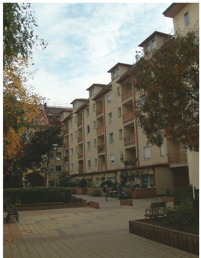
3. ábra: A 105n. mérési helyszín a Vendel sétányon többemeletes lakóépületekkel körülvéve, nagyrészt térkövel fedve, kisebb részeken parkosított, fűvel, bokrokkal borítva, s néhány nagyobb fát is láthatunk.

viszont az időbeli menet jobban követhető. A 2016. nyári mérési sorozat idején a Ferencváros területén még csak egyetlen ilyen fix helyszínű mérést végeztünk, a 2017. nyári mérési kampányban viszont négy különböző rögzített helyszínen – a 105n, 112/212, 207, valamint 209 jelű mérési pontokban – zajlottak az időben is részletesebb mérések. A már 2016-ban is működtetett 105n. pontban a Bokréta utca és a Viola utca közötti Vendel sétányon