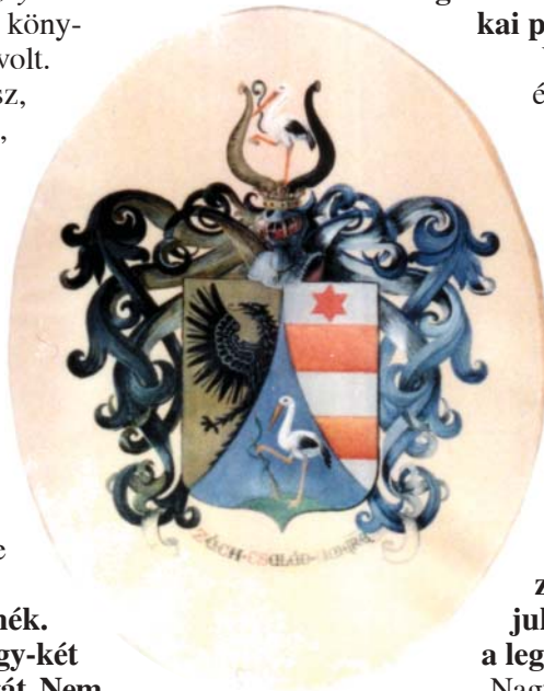
A Zách család címere

emlékéremmé. Az Hegyfokinak született, aki klimatológus volt. A Steiner nevet azért kapta, mert ő már matematikai képzettségű ember volt, de nekem fájt a szívem. Másik a Metesz-díj. Sokat dolgoztam a közért. Én kezdeményeztem, hogy legyen Légekör, legyen egy népszerűsítő folyóirat az Időjárás mellett. Én kezdeményeztem, hogy legyenek vándorgyűlések, járjuk az országot, legyen a meteorológusoknak lehetősége megismerni a hazájukat. Az alföldtől a hegyvidékig, mindig másutt rendeztük a vándorgyűlést. Amikor aztán végre egy kis lehetőség volt, hogy levegőt kapjunk, akkor kezdtük a szlovákokkal, Csehszlovákiával, és a kelet-németekkel. Nem szabadott mással. Milyen nagy bűn volt az osztrákokkal való barátságunk! Sajnos, ez az akkori kommunista rendszernek súlyos hibája volt, hogy elzártak bennünket a Nyugattól. A Tóth Géza elleni vád is, az is volt, hogy nyugati könyveket és folyóiratokat tartott a szobájában. A harmadik kitüntetésem a Schenzl Guidó Díj. Talán még egy negyediket is megemlítek, de ez nem tudományos, a Magyar Köztársaság aranykoszorúval díszített csillagrendje. Ezt a szakmánkban csak én kaptam meg eddig.