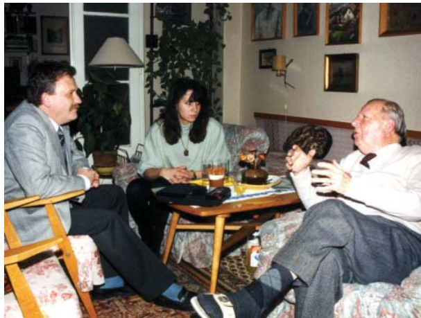
Készül az interjú:

Nem, nem volt. A hírközlés először még csak rádióon ment, s aztán lett géptávíró hálózat. Amikor Magyarország éghajlatával foglalkoztam, rájöttem, hogy Magyarországon északi növényeket is találunk, mediterrán növényeket is, Pécs környékén, sztyeppnövényeket keleten. Tehát ez egy olyan ország, ahol a növényvilág találkozik. De nézd meg az állatvilágot: ugyanaz van. Nézd meg az embereket. Itt a szlávok, germánok találkoztak. A szellemi áramlatokat: