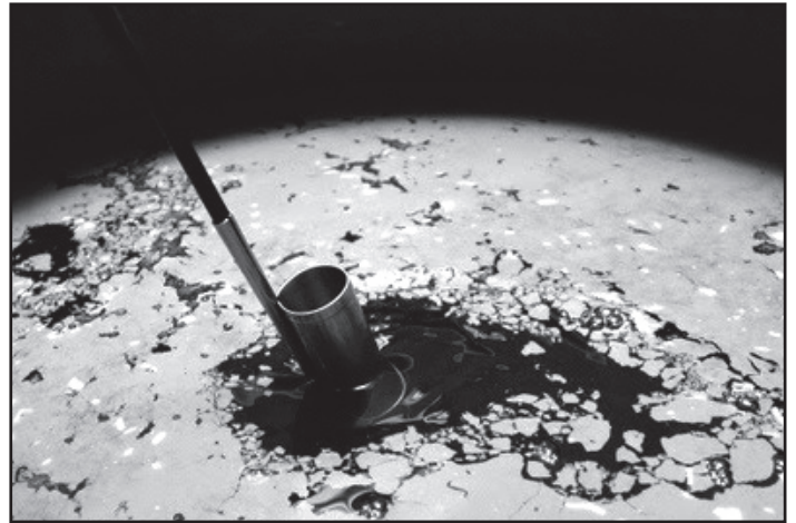
A flor és a tipikus sherry-kóstoló lopó

Az amontillado 3-8 év biológiai + 3-4 év oxidatív érlelés után kerül palackba, 16-22% alkohollal, szintén teljesen száraz, színe aranysárga vagy még sötétebb, aromavilága vibrálóan sokszínű, narancshéjas, mogyorós ízjegyeket mutat fel. Az oloroso (17-22 %) borostyánszínű, testes, rendkívül komplex, nagyon hosszú utóízű, diós, mazsolás, aszalt gyümölcsös ízjegyeket mutat. 7-10 évet érlik oxidatíván, így flor híján glicerintartalma meg-