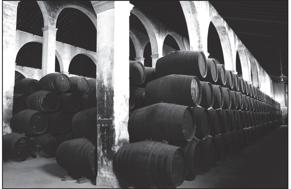
Az érlelés helyszíne, az ún. solera többszintű hordósora

Ettől azonban még tény marad, hogy az ori-