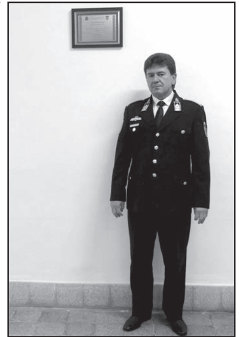
A rendőrkapitány egyenruhában

– Gazdasági válság közeledik, ami negatív hatással lesz a bűnözésre. Ha kollégáim az eredményeket meg tudják tartani, az már nagyon jó dolog lesz. Természetesen az önkormányzatokkal való további szoros együttműködés hozhat még javulást a rendőri munkában. Folyamatos fejlődésre, megújulásra van