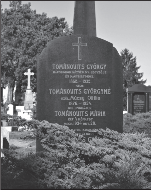
A Tománovits család sírja a Rókus temetőben