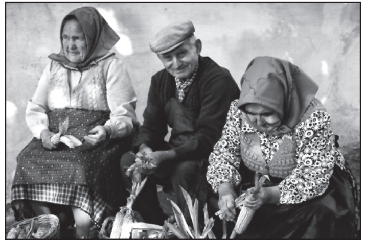
A közös munka sok élményt adhatott

A közösségi fosztók alkalmával előfordulhatott, hogy maskarások, alakoskodók lepték meg a szorgalmasan munkálkodók csoportját.