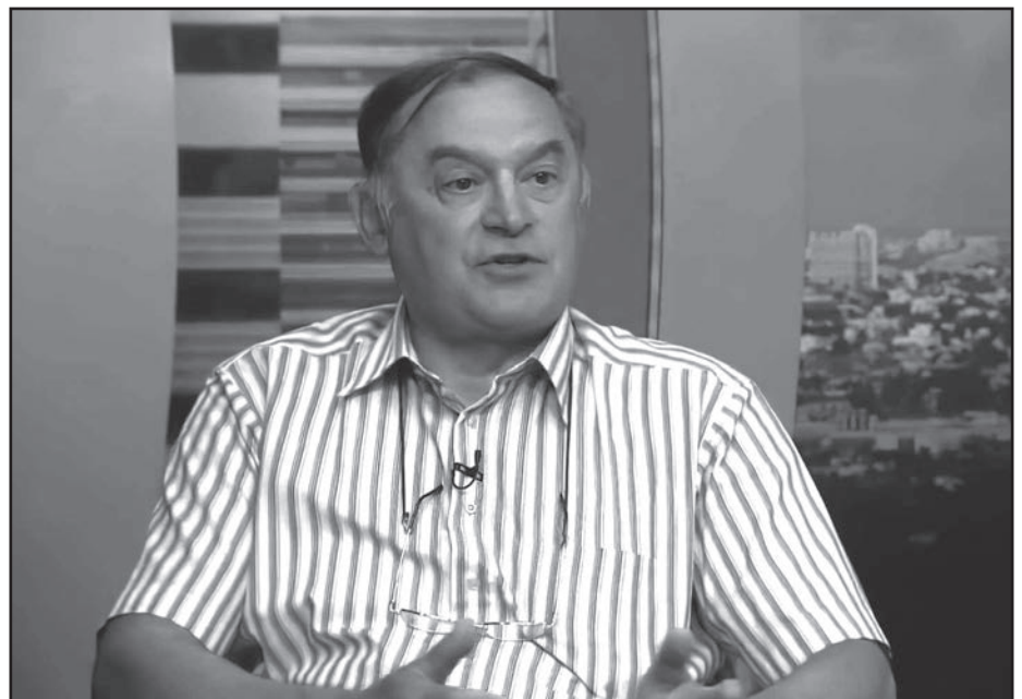
Dr. Petrekanits Máté (1949–2022)

A terheléséltan egyik legkiválóbb szakértőjeként sportágválasztási tanácsadással is foglalkozott, ugyanis vizsgálatai alapján úgy látta, hogy a gyermekek alkata, genetikai adottságai alapján előre megmondható, mely sportág maga szintű művelésére lehetnek alkalmasak, felnőttként milyen fizikai teljesítményre lehetnek képesek, de akár az is, hogy orvosi szempontból jelenthet-e rájuk veszélyt egy adott sportág művelése. „ A kulcsszó az, hogy a gyerek örömmel csinálja a választott sportágat – nyilatkozta egyszer – Mi pedig ebben segítünk: már hétéves kor körül meg tud-