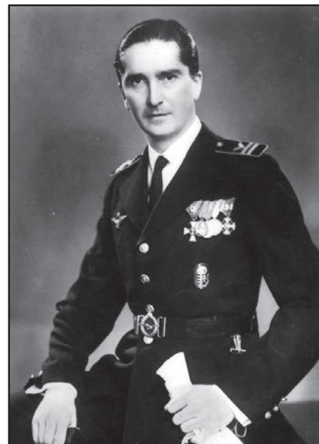
Horthy István

Posztójából adódóan számos alkalommal közreműködött gazdaságpolitikai döntések meghozatalában, valamint külföldi tárgyalások során a kormányzóhoz való egyértelmű köztudat révén vállalati szintet meghaladó módon lépett fel – a politikai vezetés jóváhagyásával. Vállalatvezetői posztja és tevékenysége elismeréseként – de nyilvánvaló módon nem függetlenül családi helyzetétől – 1940 augusztusában Jász-Nagykun-Szolnok vármegye felsőházi taggá választotta, majd 1941 júniusában államtitkári kinevezést kapott. Eközben Horthy Miklós betegeskedése miatt egyre inkább előtérbe került a kormányzó utódlásának kérdése. A háborús helyzetben az ország politikai stabilitása szempontjából kulcsfontosságú volt, hogy a kormányzói jogkör folytonossága biztosítva legyen, ezért Horthy Miklós 1941 őszén kezdeményezte egy kormányzóhelyettesi pozíció létrehozását,