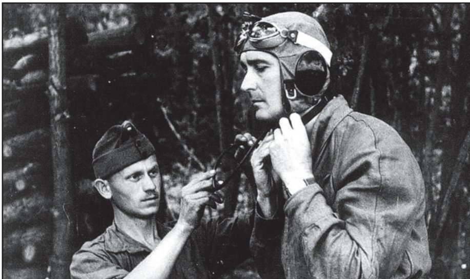
Horthy István a keleti fronton ( https://www.origo.hu/tudomany/20150820-masodik-vilaghaboru-horthy-istvan-repulobaleset-osszeeskuves-elmelet-kallay-kormany-horthy.html )

A halálos kimenetelű baleset a valóságban minden bizonnyal több tényező együttes hatására következett be. Bár Horthy István