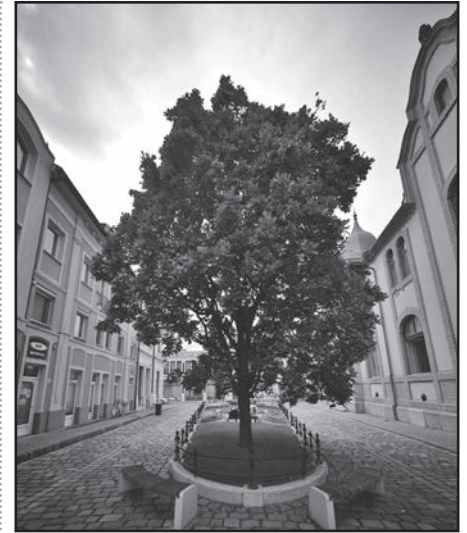
A Roosevelt tér egyetlen tölgyfája

Ezzel végigjártuk városunk általam ismert tölgyfáit. Kérem a tisztelt olvasókat, ha tudomásuk van olyanokról, melyek elkerülték a figyelmemet, jelezzék a szerkesztőség ismert elérhetőségeinek valamelyikén! ■