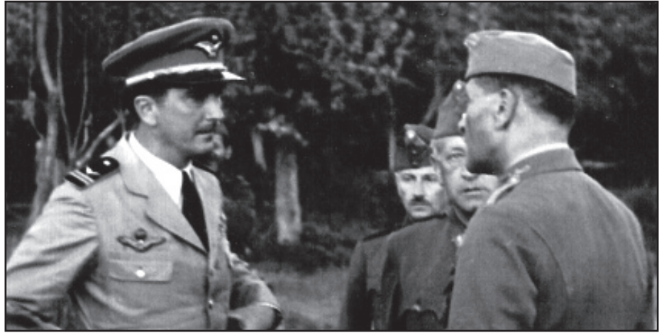
Vitéz Horthy István vitéz Jány Gusztáv vezérezredessel 1942 nyarán

Ugyanakkor az egyre súlyosabbá váló harcok miatt a hazai vezető politikai körök komolyan aggódtak testi épségéért, ezért a magyar kormány augusztus 11-én elrendelte, hogy fejezze be csapatszolgálatát, és vezényeljék át a 2. hadsereg parancsnokságára, onnan pedig néhány katonai alakulat protokolláris meglátogatása után térjen haza Magyarországra. A Szovjetunióban állomásozó katonai parancsnokság augusztus 14-én (más források szerint augusztus 16-án) kapta meg az utasítást, amelyet természetesen a kormányzóhelyettesnek is továbbítottak. Ő ugyanakkor engedélyt kért és kapott arra, hogy még egy utolsó – 25. – légi bevetést teljesítsen. Ezt megelőzően azonban még egy rövid szabadságra utazott Kijevbe, hogy találkozhasson feleségével, aki önkéntes ápolónőként érkezett a hadszíntérré, és egy kijevei katonai kórházban dolgozott. Az augusztus 15. és 18. közötti találkozás