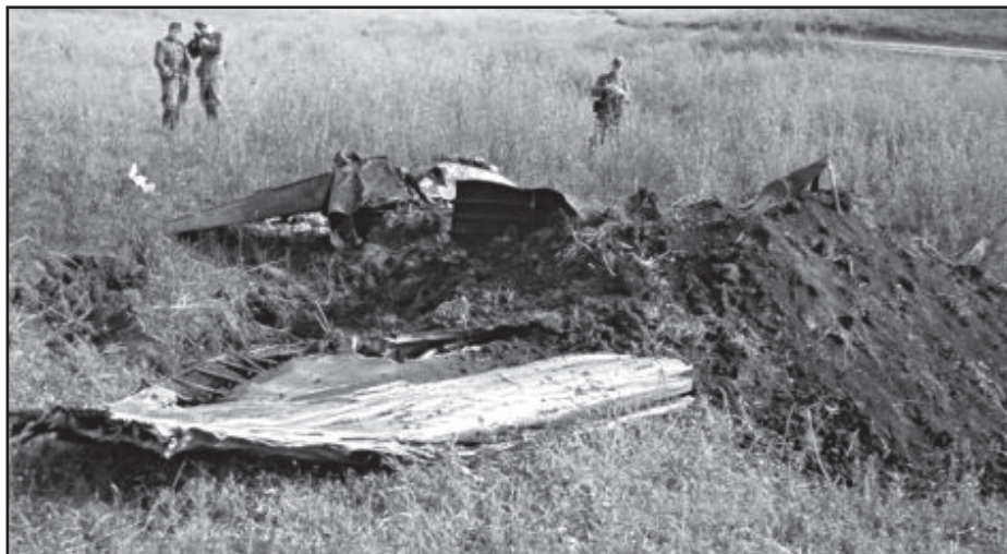
Horthy István gépének roncsa

Horthy István halálhíre még aznap, augusztus 20-án megérkezett Budapestre. A halálos kimenetelű balesetről Kállay Miklós miniszterelnök személyesen tájékoztatta a kormányzót, akit annyira le-sújtott a tragédia híre, hogy kétszer is eszméletét veszítette a sok hatása alatt.