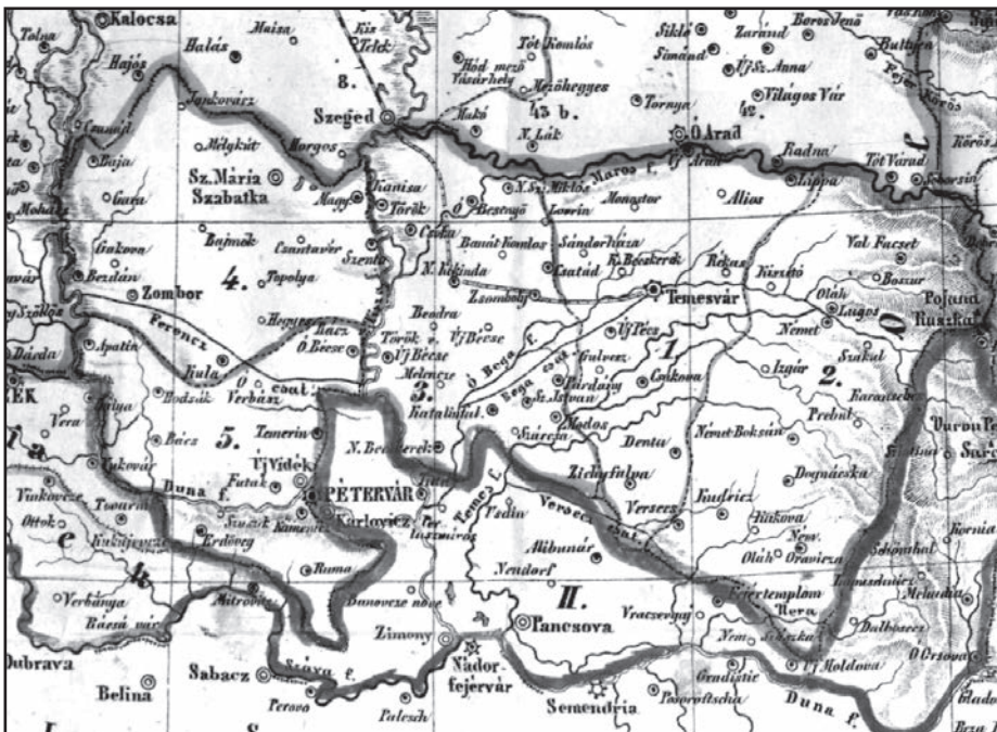
„Magyarország és Erdély, Szerb vajdaság, Horvátország, Szlavonia és kat. határvidék” 1859-ben készült térképének részlete: 1. Temes, 2. Lugos, 3. Nagybecskerek, 4. Zombor, 5. Újvidék körzetekkel és II. Szerb-bánati határörvidékkel

Az áttekintett kiadványok közös jellemzője, hogy inkább statisztikai szempontú megközelítéssel írják le vidékünk, a Duna-Tisza köze déli részét. Egyebek mellett számadatokat közölnek a lakosság számáról, vallás szerinti összetételéről, határának nagyságáról. Ezekon túl nem, vagy csupán érintőlegesen szerepel adat a tájon élő emberről, a közegészségügyi és időjárás viszonyokról, a vidék növény- és állatvilágáról stb. Mindezek szerepet játszhattak abban, hogy gróf Johann Coronini-Cronberg kormányzó (1851-1859) 1859. január 8-án kiadott 1707. számú utasításában elrendelte a koronataromány településeire kiterjedő néprajzi és helyrajzi leírások elkészítését, hogy sorai szerint ezek felhasználásával megjelenhessen egy, az országterületet bemutató összefoglaló kiadvány. Helyi szinten ennek elkészítése alapvetően a jegyző feladata