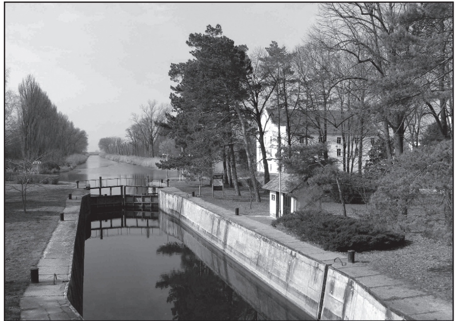
Hajózsilip a Ferenc-csatormán

A második fejezet az egyes települések időjárási viszonyairól (napfelkelte és -nyugta, hőmérséklet, csapadék, szél, évszakok rövid leírása, légnyomás), határak talajviszonyairól, növény- és állatvilágukról ad képet. Az ennek kapcsán leírtakat – hogy az 1859. esztendő teljes négy évszakáról szóljon – 1860 elején kellett az illetékes hatóságnak elküldeni. Érdekességként említhető, hogy abban a korban még nem Celsius-, hanem Réaumur-skálával beosztott hőmérőket használtak, a csapadékot egy bécsi négyszögláb alapterületű edényben fogták fel, amelyet belső oldalán bécsi coll (hüvelyk) beosztású mércével láttak