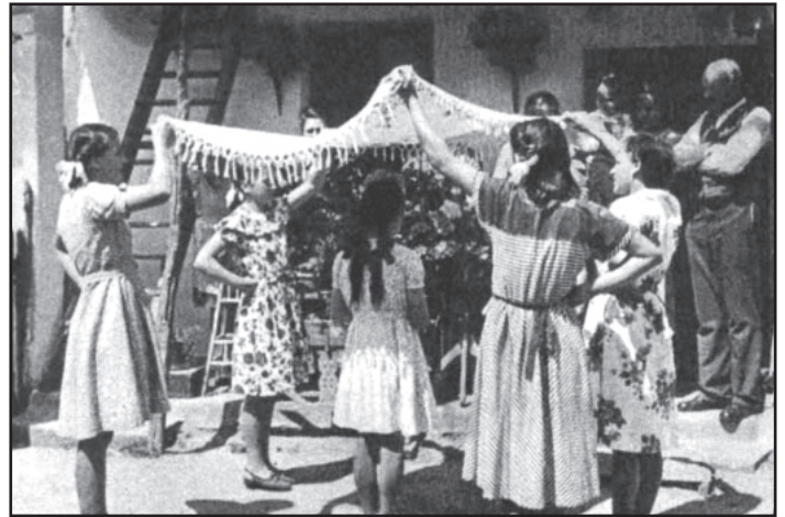
Pünkösdszokás tele van jeles népszokásokkal

Nem anyától lettem, rózsafán termettem Érdekes ez a pünkösdi szokásoknál énekelt rítusának is. Többször előkerül szövegében Szent Erzsébet neve. A pünkösdi rózsá említése nyomán kapcsolták ide, mert a fiatalon idegenbe került Erzsébet legendájában kiemelt szerepe van a rózsacsodának, mely szerint amikor a szegényeknek titokban alamizsnát vitt, s ők kérdőre vonták, kötevényben a kenyér rózsává változott. Ehhez valaha feltehetőleg egy sokkal összefüggőbb éneksorozat kötődött, régi formájára azonban csak következtethetünk, ép forrás nem őrzi. Ma több érdekes motívumot tartalmaz: utal egy titokzatos lényre, amely rózsafán termett, a pünkösdi lóversenyre, s természetesen szerepelnek benne jókívánások és adománykérő formulák is: „ Nem anyától lettem, rózsafán termettem, Piros pünkösdszokás napján hajnalban születtem./ Mi