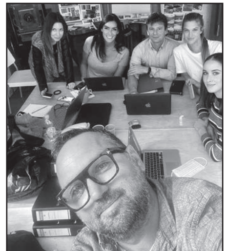
Stábértekezlet az irodában