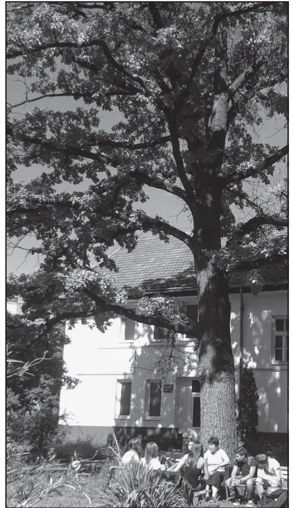
Tölgyfa a Bereczki Máté Szakképző Iskola kertjében

A sok szép szó után azonban azt is el kell mondanom ezekről a fajokról, hogy városi fásításra kevésbé alkalmasak. Hatalmas méretük miatt nagy térben, parkokban tud igazán kibontakozni szépségük. Lassú fejlődésük miatt pedig csak az ültetők unokái