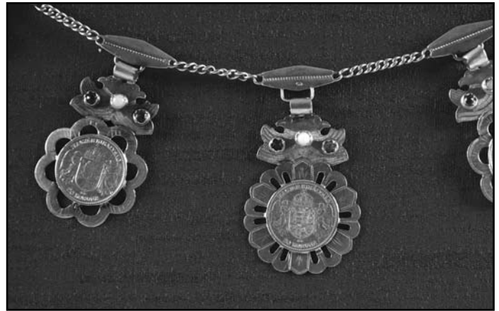
Arany pénznyakék részlete