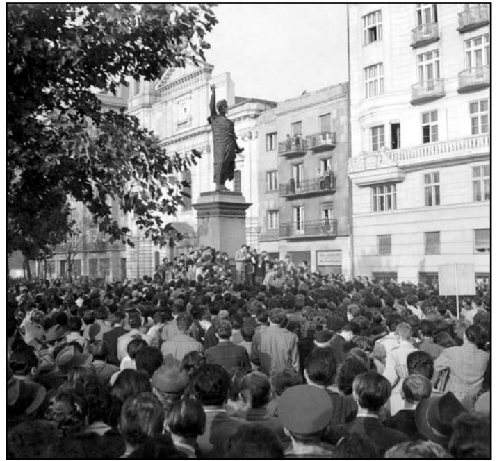
A forradalom egyik emblematikus helyszíne, a budapesti Petőfi-szobor

A Magyar Nemzeti Bank fiókjában dolgozott az elhunyt polgármester egyik lánya, akinek udvaroltam, aki megtanulta az aláírást, és később, állítólag, hatalmas összegeket sikkasztott. A hűgát tanítottam, nagyon utált (...). Ekkor már (1957 januárjától) semmilyen kapcsolatunk nem volt, mert karácsonykor egy társasággal elindultak nyugatra, elkapták őket, s mind a nyolcukat pár nap múlva szabadon is engedték. Még a munkahelyükről sem bocsájtották el őket. De ettől kezdve csak köszöntünk egymásnak (...). Azután amikor a nyomozók rájöttek, hogy az aláírások nem az enyémekek (...), egyetlen kiutat talált: öngyilkos lett (...). Engem még 1962-ben is bíróság elé kívántak állítani néhányan. Olyanok, akiket nem is ismertem.”