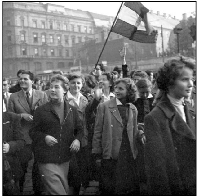
Diákok az október 23-i demonstrálók között

A népfelkelés erői viszont egyre jelentősebb változásokat készítettek elő: megjelentek a csírái egy piacgazdaságon alapuló többpárti polgári demokráciának, amelyben – várhatóan – a szabadság kisebb és nagyobb köreinek minden eddiginél nagyobb szerepük lesz. A szovjet invázió vágta el ennek a kibontakozásnak a fonalát. A szovjetekkel szemben – főként 1944-45-ös magatartásukra visszavezethető, de 1849-es szerepüket sem feledő – ellenséges közérzet volt országszerte. Az állandó veszélyérzet ösztönös ellenállást váltott ki velük szemben. Az ellenállás a népfelkelés szívével, Budapestet kívánta védelmezni, a keleti országhatár átlépését meg akarta akadályozni, az országban mozgó alakulatokat pedig nyugtalanítani. Kisebbségi fegyveres összetűzések, barikádok építése, sínek felszedése, berendezkedés körkörös védelemre, egyéni és csoportos akciók jelezték az elkeseredést, az érzelmektől fűtött elszántságot. Október