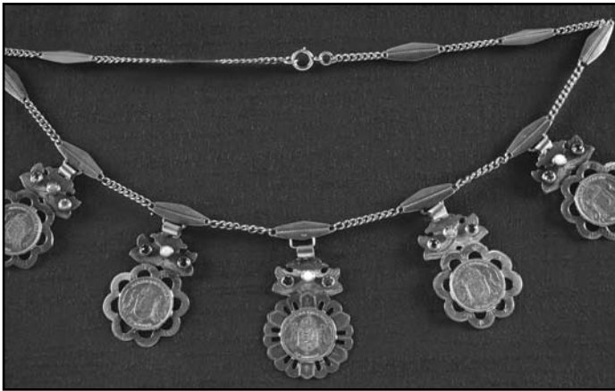
Arany pénznyakék Érsekcsanád, 1910-es évek vége