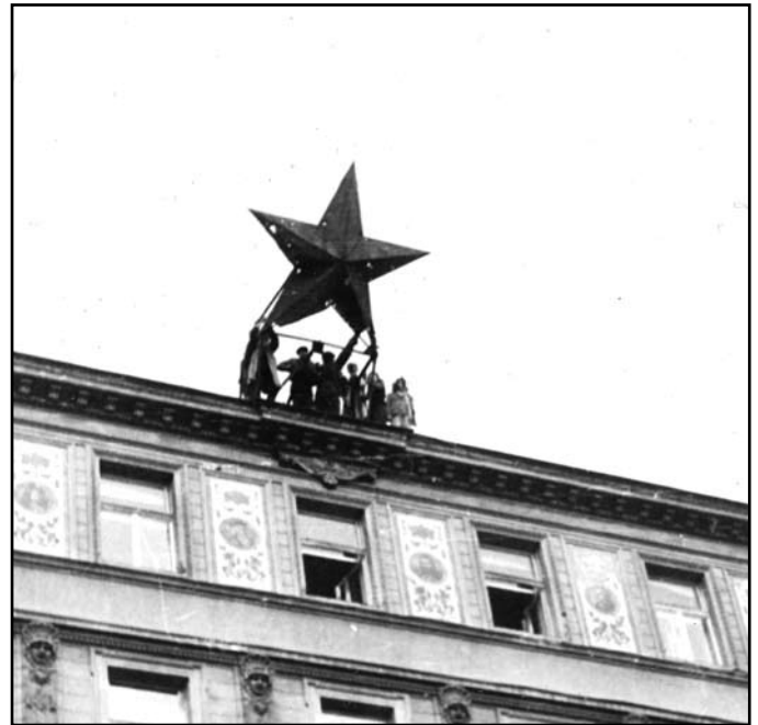
A vörös csillag eltávolítása egy középületről, 1956