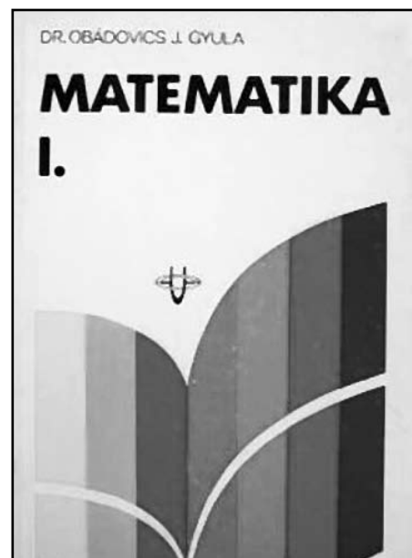
A számtalan kiadást megért, klasszikus tankönyv