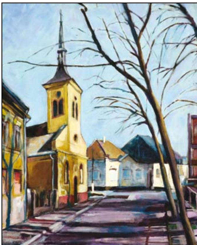
Evangelikus templom (Baja)