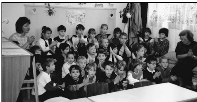
Az első osztály 1993-ból

Az ovis évek után bizony eljön a perc, hogy a szülőknek iskolát kell választaniuk gyermekük számára. Persze nem is olyan nagy feladat ez, ha van már előttünk jó példa, tapasztalat. Mivel a keresztény iskola 1992-ban nyitotta meg kapuit, úgy döntött a család, hogy a Vöröskereszt téri óvoda tapasztalatai után megpróbálunk egy olyan iskolát, amely más lesz, mint a többi. Valóban az volt. Szentmise, hittanóra, egyetlenegy osztály, a régi Tóth Kálmán iskola épületének hátsó kisudvarában a középiskolások között szaladgáló kis elsősök... Ilyen tényleg nem volt máshol!