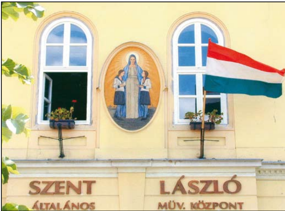
A Szent László ÁMK homlokzata