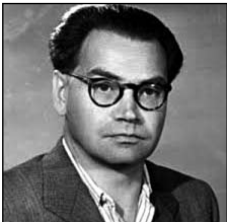
Losonczy Géza (1917-1957)

■ A 20. század magyar történelmének számos olyan ellentmondásos figurája van, akik egyes tevékenységeik alapján a nemzeti panteon részei lehetnének, ám múltjuk néhány fejezete miatt alakjukra joggal vetül árnyék. Nyugodtan közéjük sorolható a Nagy Imre-per egyik áldozata, az éppen 100 éve Érsekcsanádön született Losonczy Géza is. Életének csak viszonylag rövid időszaka kapcsolódik környezetünkhöz, ám fordulatokban gazdag életpályájának vázlatos áttekintése az évforduló kapcsán talán nem indokolatlan, főleg hogy neve az utóbbi idők megemlékezéseiből kikopni látszik.