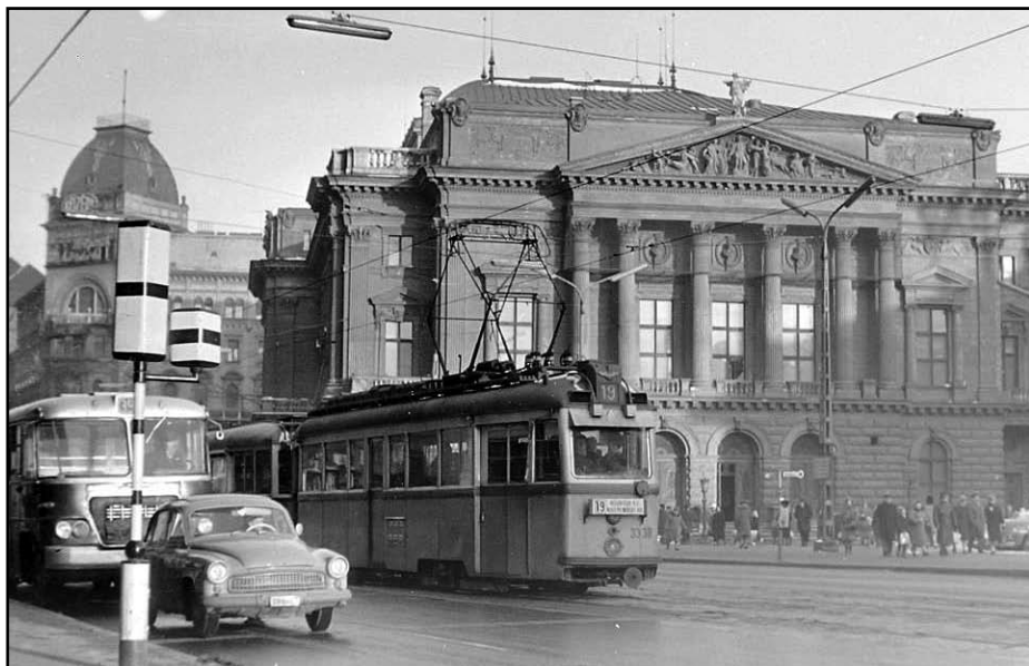
A Nemzeti Színház környéke az 1950-es években

1954-ben a „típuskönyvtárak” anyagában a kötetek 79%-a szovjet szerzőktől származott. A Munkaerő Tartalékok Hivatala kifogásolta is, hogy a növendékek (a munkásosztály utánpótlása!) nem találnak a küldeményekben olyan alkotásokat, amelyek iránt érdeklődnek, amelyek szakmai fejlődésüket szolgálják. A küldött anyagok többségét senki sem veszi kézbe, olyanokat pl., mint Popov Acél és salak c. írása. Tiltakozásuk nem maradt hatástalan. A Kiadói Tanács megalakulása, különösen pedig a Nagy Imre vezette kormány programjának meghirdetését követően a fő kérdés a könyvkiadás helyes arányainak kialakítása volt. Csökkentették a szakmai és a tankönyvek részesedését, és emelték a szép- és ifjúsági irodalomra fordítható papírmennyiséget. Szakmai elemzések hívták fel a figyelmet arra, hogy az