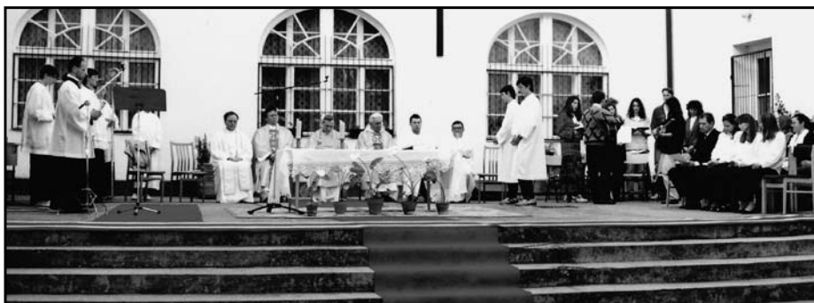
Szentmise az alapkövetétel 125. évfordulóján, 1995-ben

A kitartó hozzáállás és az újabb hirdetés meghozta az eredményt: 19 gyermeket írtattak be a szülők az első osztályba. A kimutatások szerint azonban a város egyetlen iskolájában sem volt üres osztályterem.