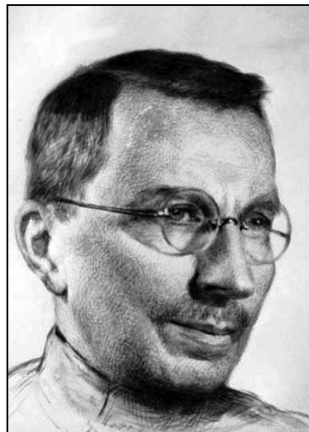
Makarenko, a „haladó” pedagógia atyja