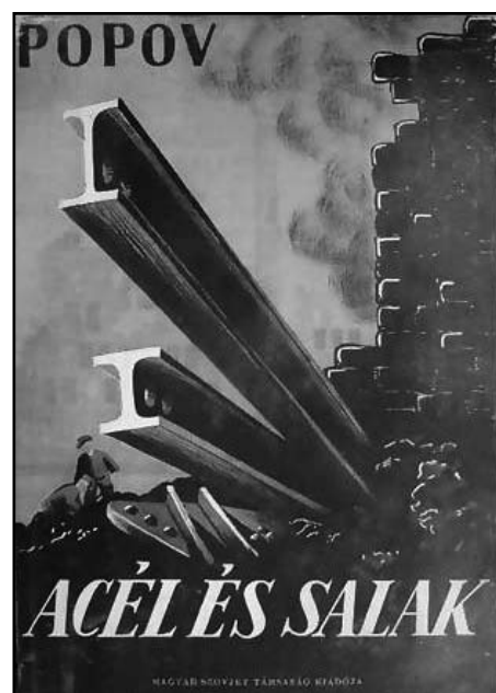
A munkásosztály dicsérete egy kurzusműben

Úgy érzem, az előadottak után szükségtelen egy részletes összefoglalás. A Szovjetunió törekvései a változó nemzetközi erőviszonyok között lehetőséget adtak a magyar politikai elitnek, hogy a kultúra területén is távlatos eredmények részére törjenek utat. Ezek a lépések nagy áldozatokat követeltek, és vegyes (értékes és káros) következményekkel jártak. A dolgok természetéből adódóan megnyugtató mérleget vonni nem lehet. Az viszont kétségtelen: ha az 1945-ben megkezdett úton haladhatott volna tovább a magyar nép, az arányok