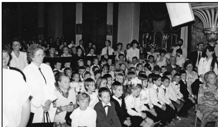
Veni Sancte 1994-ben