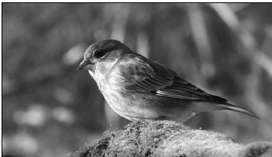
A fiatal madarak tollazata fakóbarna alapszínű

■ Környezetünkben – legyenek ezek parkok, utcák, lakótelkek vagy akár a városunkat körülvevő erdők – tavasszal, nyár elején mindig sok a látni- és megfigyelni való. Virágaikkal ilyenkor mutatják legszebb arcukat a növények, aktívak az ekkortájt már előbújt rovarok, repülnek a nektárt kereső lepkék-pillangók, mindenfelől a madarak éneke hallatszik. Utóbbiak közül alkalmanként kitűnik egy trillák, csicsergések és füttyök sorozatából álló és sok „zs”-t tartalmazó ének, amelyet a madarászok „zsirozásnak” neveznek.