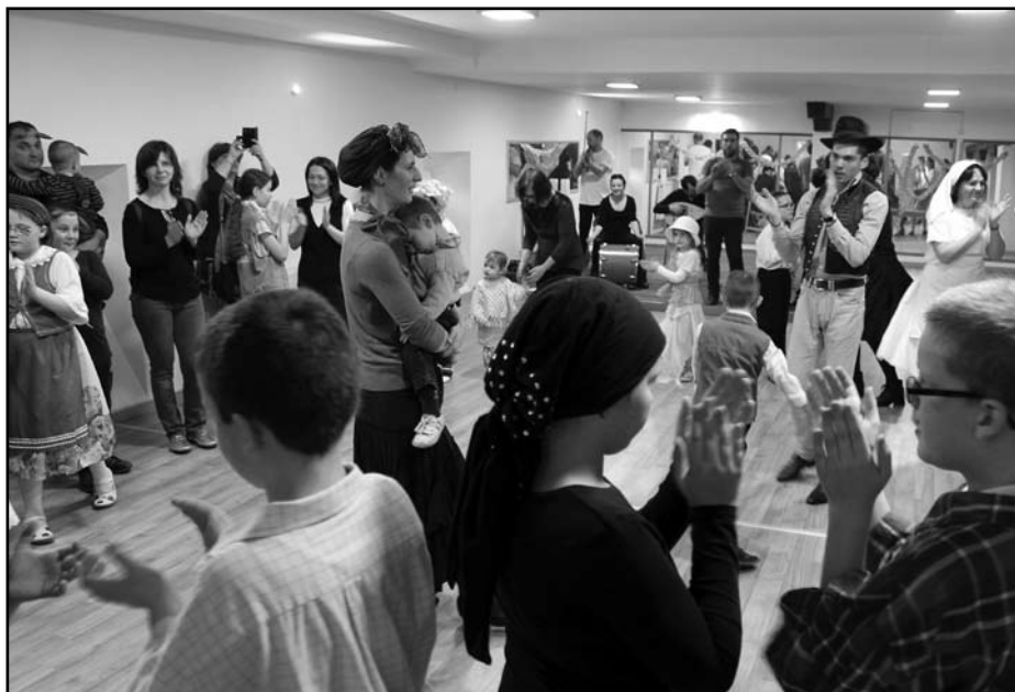
Közös táncház, jó mulatság

F.F.: Másfelől az is továbbképzésnek számít, maga az is fejlődés, hogy nemcsak a tanításnak élünk, hanem a különböző fesztiválokon hétről hétre látjuk az aktuális trendeket, illetve a szakmánk fejlődését. Ezekből már nagyon sokat lehet tanulni, amikor az ember vagy résztvevőként vagy nézőként van jelen, esetleg oda visz egy csoportot. Nálunk ez még gyerekcipőben jár, hisz ez az első, alakuló évünk, tehát nagy versenyekről még nem beszélünk, de