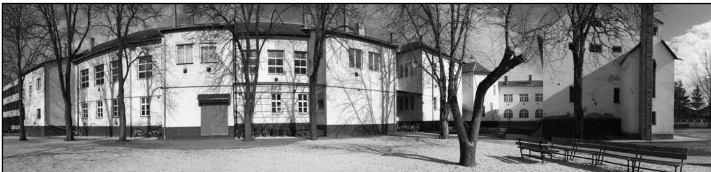
Panorámakép az udvarról