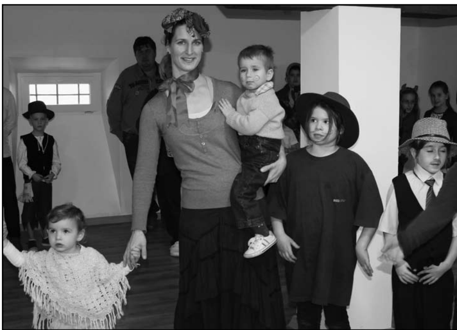
Az ünnepeket is együtt ülük meg

Ö.T.: Volt egy szép karácsonyunk, volt egy jó farsangi bulink, remélem, hogy az év végi vizsga alkalmával, ami egyébként egy gálaműsor lesz a Bajai Városi Színházteremben június 1-jén, komoly műsorral tudjuk kecsesgetni a nézőket. Nyáron lesz népzene, néptánc és népi ének táborunk a Csobbantó majorban, Dunafalván július 10-től 15-ig, ahol szintén komoly programokkal készülünk, és komoly apparátust vetünk be, hogy a növendékeinknek jó élményeket és valami igazán értékeset adjunk. A jövőben pedig, ha olyan néptánc-koreográfiák és zenei produkciók, kamarazenélések készülnek, amelyek színpadra valók, és a leendő előadókat is fel tudjuk készíteni, hogy akár versenyen, akár gálaműsoron vagy más előadáson éretten lépjenek a színpadra, akkor ezek lesznek az igazán érdekes kihívások, igazán jó programok. Történtek már ilyenek, vannak olyan felkérések, amelyeknek már eleget tettünk, most viszont még alapos munkával töltjük ezt az időszakot. Nem akarjuk elsietni a fellépéseket, ugyanis nagyon odafigyelünk arra, hogy a gyerekeket ne ériék rossz első élmények a színpadon. Azt szeretnénk, hogy a csoportjaink meg a koreográfiáink csak akkor kerüljenek szín-