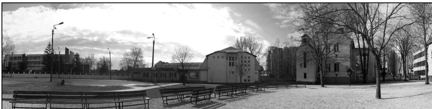
Panorámakép az udvarról

Sok év után 1998-ban a tulajdoni kérdés is rendeződött: kiszámították, mekkora volt az önkormányzati kézben maradó III. Béla Gimnázium alapterülete, majd felmérték, mekkora az új építésekkel együtt a mi intézményünké, a különbözetet pedig a végzés szerint ki kellett fizetni a ciszterci rendnek. 1999-ben a jogszabályi változások miatt kiegészítő támogatásokat csak egyházi, illetve önkormányzati fenntartású intézmények kaphattak, így az intézmény vezetése újabb változtatásra kényszerült. Tárján Levente igazgató először Zakar Ferenc Polikárp zirci főapátot kereste meg, de ő nem mutatott komoly érdeklődést egy újabb ciszter iskola működtetése iránt. A Miasszonyunkról Nevezett Kalocsai Iskolánövér Társulatának általános főnöke, Máriai Franciska M. Romualda támogatta a megoldást, és a Rendi Tanács döntése után elvállalta az intézmény