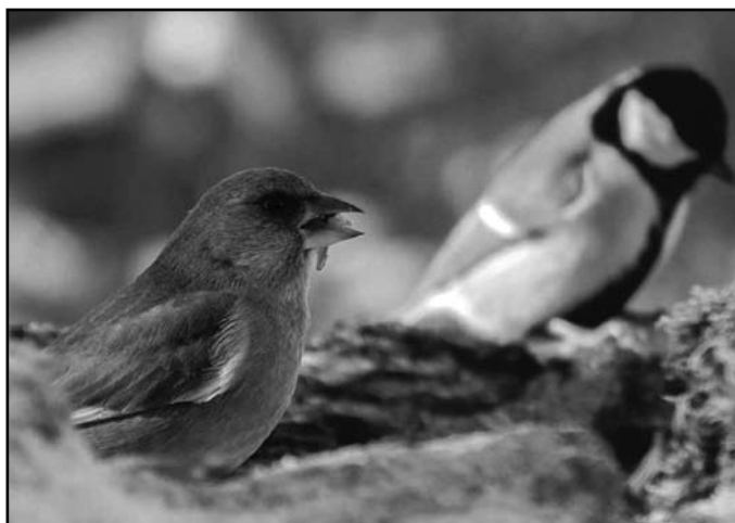
A zöldike gyakran megjelenik a téli etetőn (háttérben egy széncinege)

később hernyókkal és kisebb rovarokkal etetik fiókáikat (költési időszakban ezek jelentik a faj fő táplálékát). A fiatal madarak a fészke elhagyása után egy ideig repülés közben még bizonytalanul mozognak. Ebben az időszakban az öreg madarak gondoskodnak róluk, óvják, és gyakran a földön vagy cserjék ágain etetik őket. A fajra