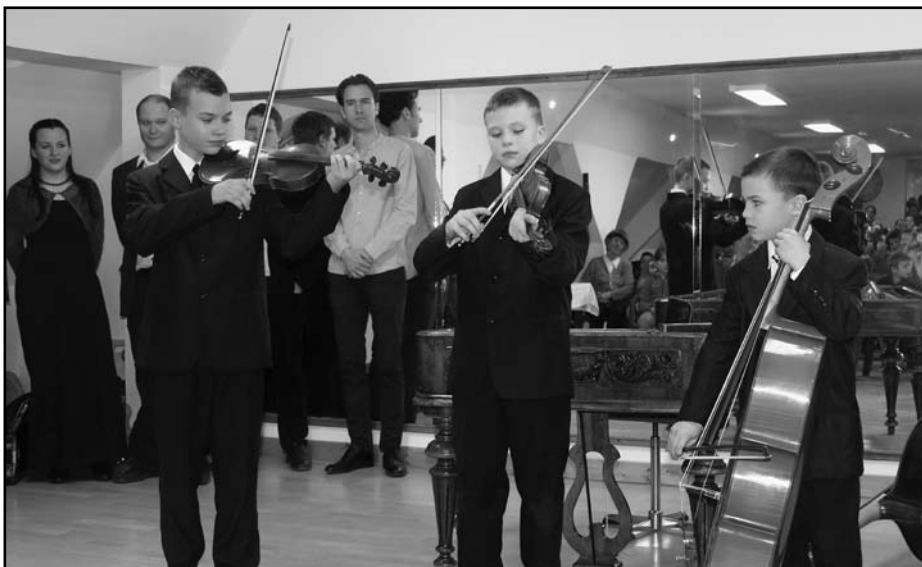
Már a kicsik is ügyesen húzzák

– Hogyan kerültek Bajára? Milyen út vezetett a Danubiához?