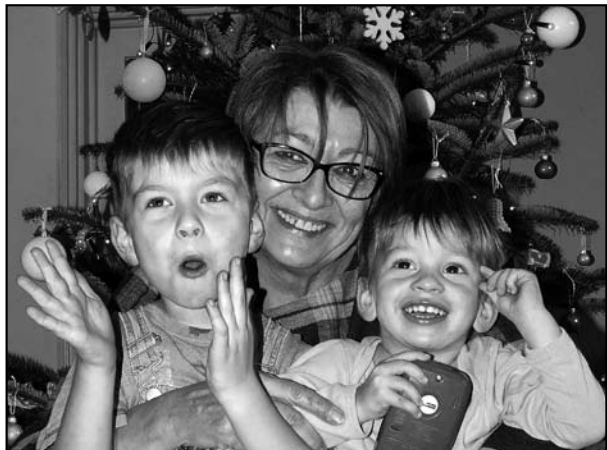
A legnagyobb boldogság: együtt az unokákkal

– A legfontosabb a helytörténeti és történeti dokumentációs gyűjtemény. Úgy szeretnék 2018-ban nyugdíjba menni, hogy rendben adom át ezeket a gyűjteményeket, melyek a múzeum legdinamikusabban gyarapodó egységei. Még igazgatói időszakomból – amikor sok feladatra egyedül voltam – van-