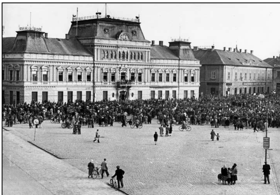
A tanács-háza 1956 előtt homlokzatán a vörös csillaggal

A városi tanács október 22-én délután 4 órakor kezdte meg ülését a Városi Tanács-háza nagytermében. A tanács létszáma 101 fő volt, ebből 66-an jelentek meg az ülésen, 16 fő bejelentette távolmaradását, ezért ök