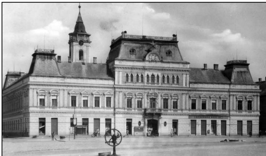
A városháza a forradalom napjaiban