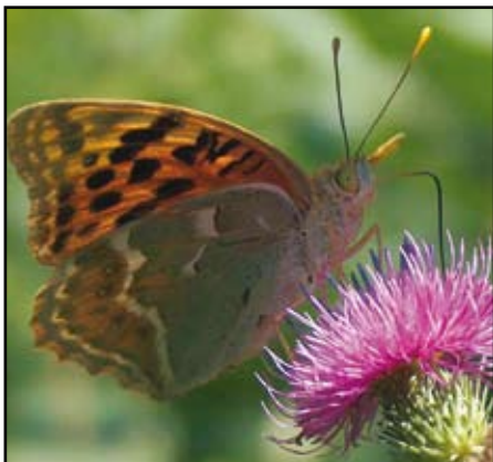
Pödörnyelvvel a bogáncs virágjából nektárt szívogató zöldes gyöngyházlepke

Berzsenyi Dániel A közelítő tél című versének első strófájában az évszakváltás természeti-környezeti változásairól. Előzőek egyik következményeként szeptemberben és októberben jellemzően egyre csökkenő egyedszámban találkozunk lepkéinkkel. Közéjük tartozik a megjelenésükkel szemet gyönyörködtető tarkalepkék (Nymphalidae) családjába sorolt zöldes gyöngyházlepke ( Argynnis pandora ): a május végétől repülő faj példányai kedvező időjárás esetén akár még októberben is felbukkanhatnak kertjeinkben, parkjainkban, és megpillanthatjuk a városunk környéki erdőkben tett sétáink-túráink alkalmával is.