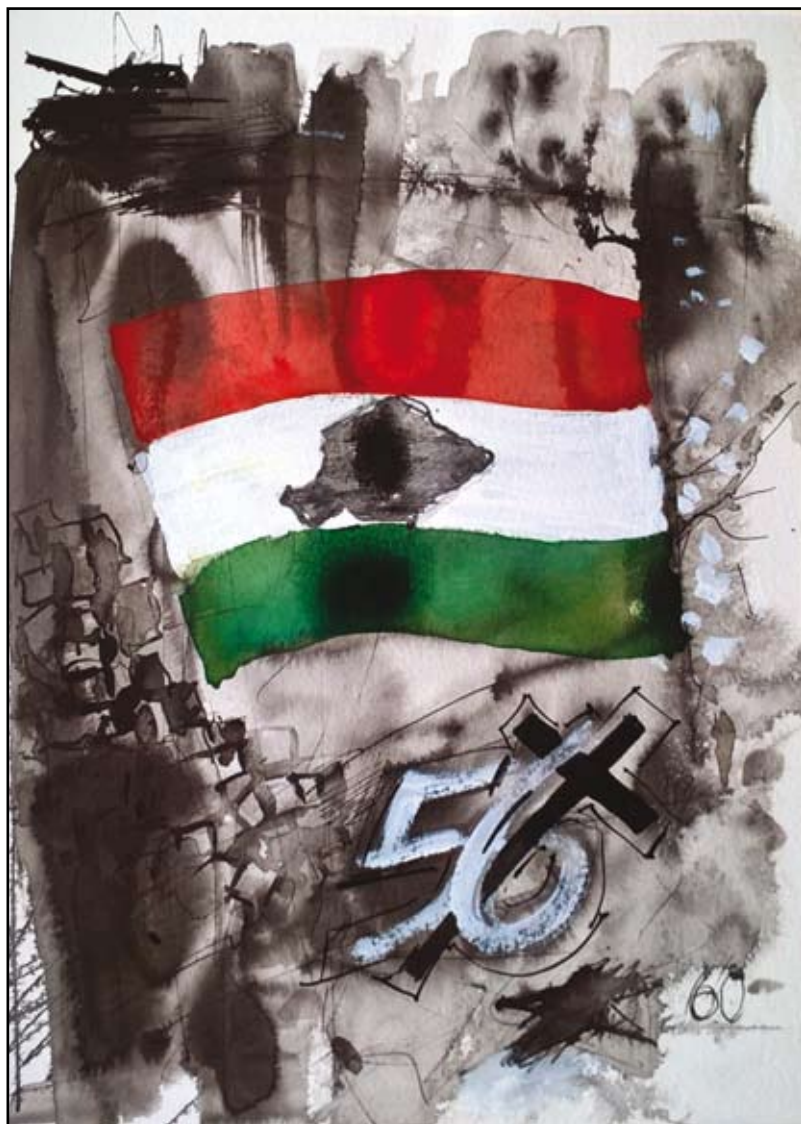
Sipos Loránd: Az én 56-om