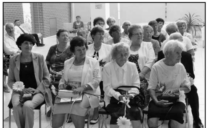
A díjazottak egy része