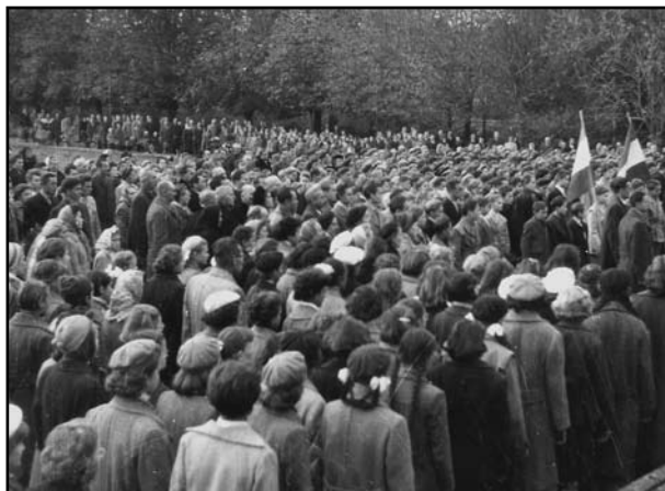
A tömeg a Déri-kertben tartott gyűlésen

E nap délutánján a diákotthonban a helyettesem helyettesített. Kb. 9 óra tájban érkeztem haza. Közölte velem, hogy az iskolák pár nap szabadságot adtak, s ő a gyerekeket – akiknek nem volt járművük – el is engedte. Közölte még, hogy 2 fiú délután valami ifjúsági memorandumot megfogalmazó gyűlésen volt. Egyiket a gimnázium, másikat a tanítóképző jelölte ki. Közölte, hogy elengedte őket, mivel az iskola jelölte ki őket. A gyűlés – közlése szerint – a technikumban volt, kb. 16 fő vett részt, mint a gyerekek elmondják, s őket bízták meg a határozat megszövegezésével! A gyerekekkel már nem tudtam beszélni, mivel hajnalban elutaztak ők is pár napra haza. (C. Imre