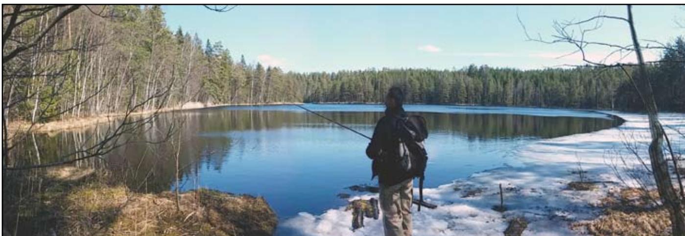
Tó jege alól „kicsalogatott” csuka: a lékhorgászat nagy előnye, hogy nem kell attól tartani, hogy délutánra megromlik a reggel kifogott hal...

A gombaszedésben is, de a horgászatban kiváltképp a párom a szakértő. Volt pillanat, amikor még varázslónak is gondoltam, mert egy ponttyal tért haza – ami addigi tudásunk szerint Finnországban egyáltalán nem is található. Azóta kiderült, hogy telepítettek pontyot, ezért el lehet csípni egyet-egyét, ha jó helyen próbálkozik az ember. De az itteni éghajlatot nem igazán szeretik, a hidegben nem ívnak le. A finn horgászok többsége nem