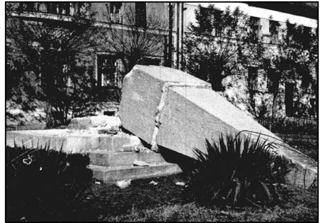
A ledöntött szovjet hősi emlékmű a Tanácsköztársaság téren