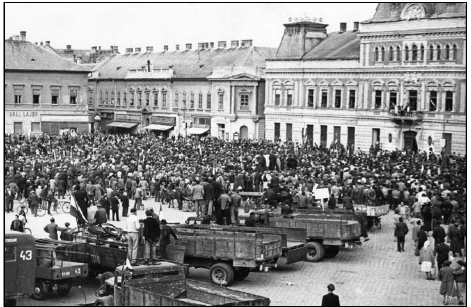
A Béke (ma: Szentháromság) tér a forradalom napjaiban

Számomra ez volt egyike a legnehezebb napoknak. Ebéd közben telefonhoz hívtak.