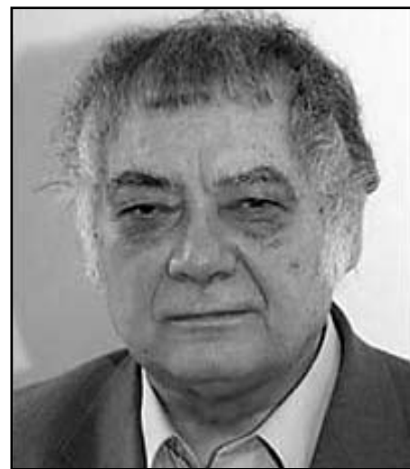
Csoóri Sándor (1930-2016)

„Hogy mit kell nekünk még elviselnünk, a kiéhezett jósok sem tudják. Lehet, hogy egy napon már senki se marad a közelünkben, csak a bőröndjeink, csak a hajszálaink, csak bevetetlen águnk a napsütésben. A könyveink nagyon okosak lesznek, mint a sértetlenül kihantolt sírleletek. Írva áll bennünk a jóváhagyatlan élet eposza, a pünkösdi seregszemlék napiparancsa vérbetűkkel, az esők verse, az emberárulás verse, a versben megromlott világverse, de mindez oly túlvi-