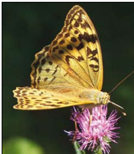
A lepke szárnyfelszíne a többi gyöngyházlepke fajhoz hasonló

A lepkék világában 62-80 milliméteres szárnyfesztávolságával közepes nagyságúnak mondható fajon jól észrevehető az ivari kétalakúság. A hím szárnyai barnás-sárga alapszínűek; mindemellett az elülső szárny tő körüli és a hátulsó szárny belső része zöldes. A hímre jellemző alapszín a nősténynél csupán az elülső szárny csúcánál és annak külső szegélyén, valamint a hátulsó szárny utóbb említett hasonló részén figyelhető meg (másfelé zöldes a megjelenés). A fajra jellemzően mindkét nemnél az elülső szárny fonák oldalának csúcshoz közeli tere élénken zöldes, a többi része fekete foltokkal tarkítva húspiros színű. A hátulsó szárny fonák oldala élénkzöld, díszítését ezüstös-fehéres haránt irányú sávok, vonalak és pontok adják. A tor és potroh szőrei a szárnyakhoz hasonló alapszínűek. A lepke hosszú pödörnyelvét pihenés vagy repülés közben feje alsó részénél felteker-cselve tartja.