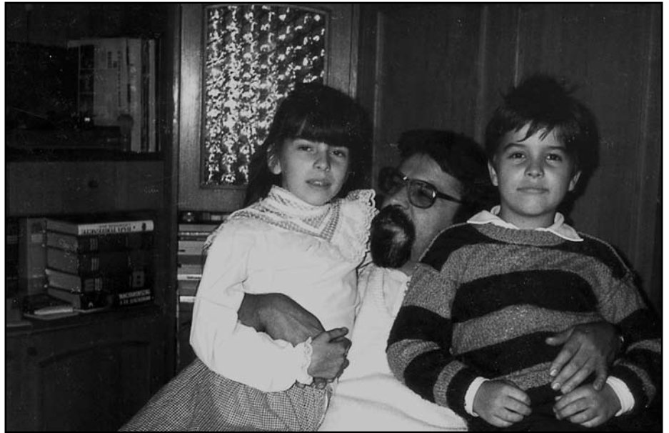
Emlék a múltból: a férj a gyerekekkel