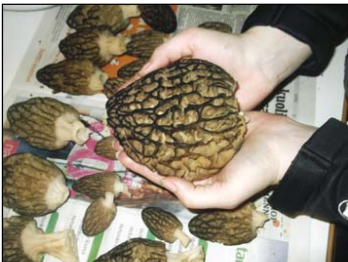
Sárga róka: megfelelő csapadék esetén tenyérnyire is megnő

■ Finnország kétharmadát erdő borítja, ami remek kikapcsolódási és „élelemgyűjtési” lehetőséget biztosít mindenki számára. Itt mindenkinek joga van a természethez, így a bogyógyűjtéshez és gombaszedéshez, az orsó nélküli horgászathoz és lékhorgászathoz is az ország egész területén.