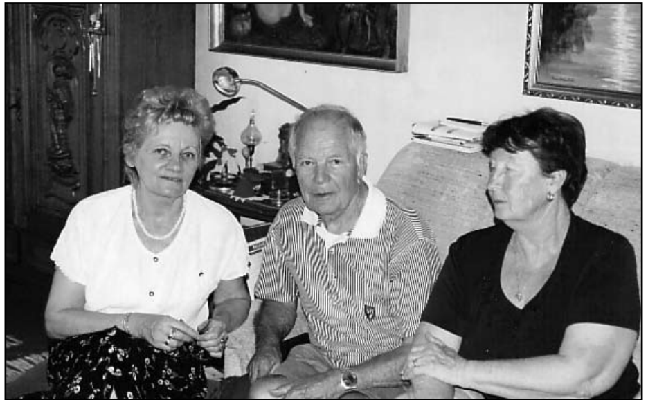
A szerző felesége az 56-os emigránssal és feleségével