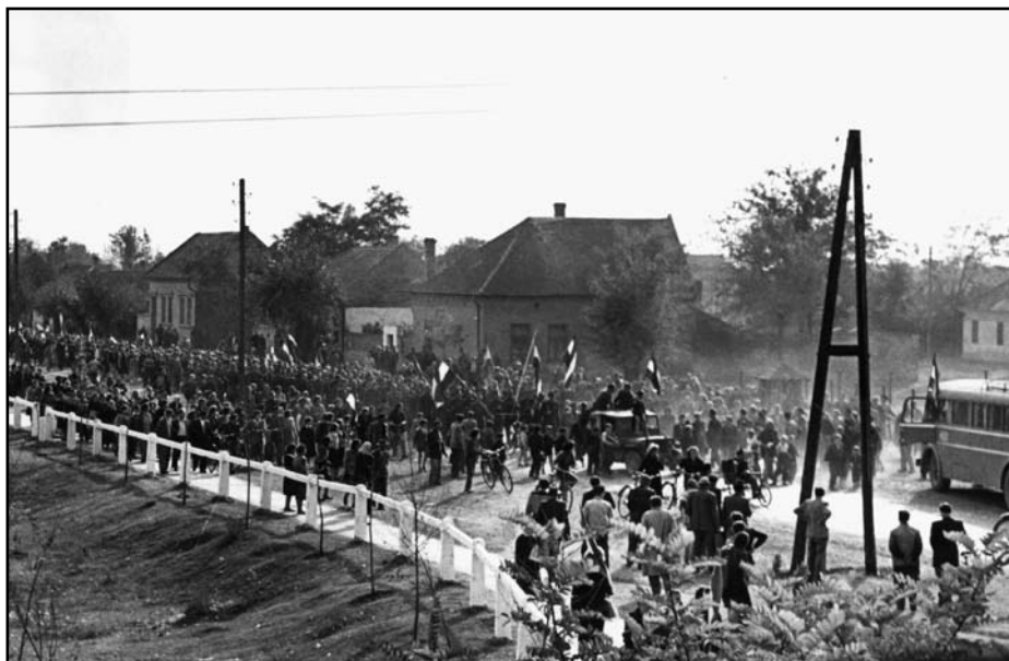
A tüntetők útban a Vaskúti úti laktanya felé