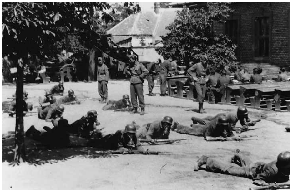
Folyik az altisztjelöltek kiképzése a felvégi iskola udvarán

Reimer így emlékszik: „Ukrajna egykor virágzó német településterületén, Halbstadt (ma: Molocsanszk – a szerk.) város térségében 1942 márciusában állították fel az 1. népi német lovasezredet, amely előbb a Wehrmacht, majd a Rendőrség, végül a Waffen-SS alárendeltségébe került. 1944 májusában 180 válogatott katonát, köztük