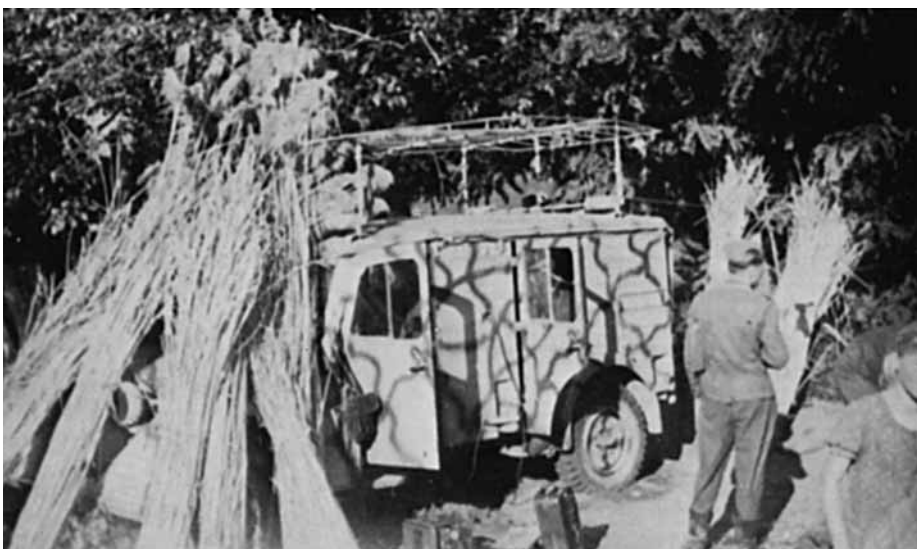
A kiképzésen hangsúlyt fektettek az álcázás gyakorlati fogásainak elsajátítására is