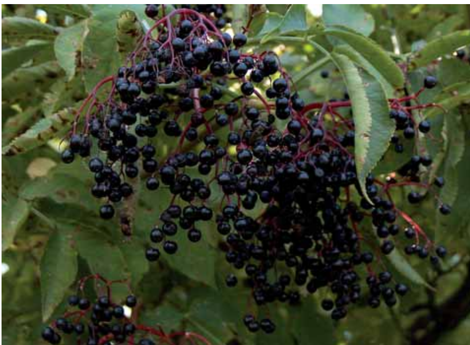
A lecsüngő termések kocsányai bíbor lila színűek