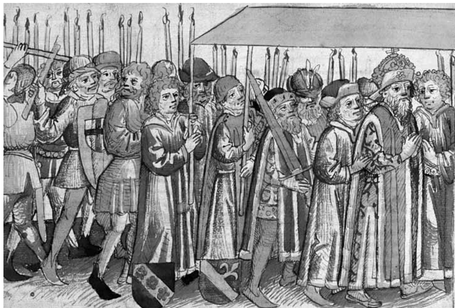
Zsigmond király és kísérete megérkezik Konstanzba (Ulrich Richental krónikája)

Zsigmond némi ravaszsággal meg tudta győzni a pisai pápát, hogy a szakadás megszüntetése érdekében hívja össze a (16.) egyetemes zsinatot, amelynek helyszíne Konstanz lett. A választást főképp az indokolta, hogy a kis német város a kereskedelmi útvonalak metszéspontjában feküdt, és az Alpokon átkelve Itáliából, valamint vízi úton Nyugat-Európa felől is viszonylag könnyen megközelíthető volt. Másrészt püspöki székhely, amely azonban a német király (és nem valamelyik pápa) fennhatósága alatt állt. A három pápa közül a zsinaton csak XXIII. János jelent meg, mert a gyűléstől saját hatalmának törvényes megerősítését remélte. Kezdetben (1414 novemberében) csak az öt támogató főpapok voltak jelen, de rövid időn belül mintegy 600 egyházi és rengeteg világi személy (3 pátriárka, 29 bíboros, 33 érsek, 250 püspök, több mint kétezren a 37 egyetem tudós képviselői közül, de még néhányan a keleti keresztények közül is) érkezett a gyűlésre. Magyarországot is több főpap, valamint a Zsigmond által alapított óbudai egyetem küldöttsége képviselte. Miután a főpapok hatalmas kíséretet hoztak magukkal, könnyen elképzelhető, mennyire megnőtt a népsűrűség a jelentéktelen kereskedővárosban! Richental krónikája egyenesen 70 ezer látogatóról beszél. Ez valószínűleg túlzás, de hogy mekkora terhet jelentett négy éven keresztül több tízezer