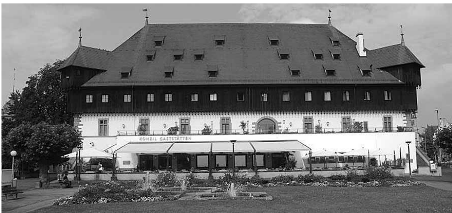
A zsinat épülete, a pápaválasztás helyszíne

többnyire hozzá hasonlóan francia származású pápák a francia korona engedelmes kiszolgálóivá váltak, s részt vettek annak kétes ügyeiben is, pl. a templomos lovagrend kirakatperében vagy a már rég halott, egykor Szép Fülöppel szembeszegülő VIII. Bonifác pápa perében. Ha a francia királyokkal szemben nem is, más hatalmakkal szemben a Kúria világalpolgári igényeiből sokat érvényesíteni tudott, és a pénzgazdálkodásra való sikeres áttérésnek köszönhetően a nyugati világ első számú pénzügyi hatalmává lett.