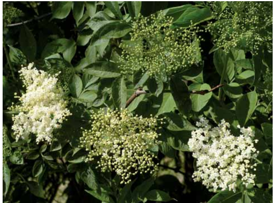
A végálló sátorvirágzat jóval a lombfakadás után nyílik

Őseink életében betöltött szerepe okán több szólásmondás is született a bodzával és bodzafával kapcsolatosan. „A kinek a gyomra fáj, keressen rá bodzát” – javasol-