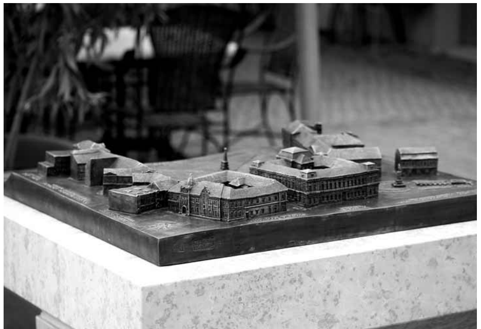
Baja szépségei tapintható módon

A kezdeményezés terjedni kezdett, előbb Amerika többi tagállama, majd Kanada, az Egyesült Királyság és Európa felé is. 1922-ben alakult meg a nemzetközi szervezet. Szükségesnek tűnt megszabni a működés egységes kereteit. Az erőforrások optimalizálására alapítványt hoztak létre. Jelenleg világszerte 200 országban mintegy 70 ezer klub működik, hozzávetőlegesen 1,3 millió tagot számlálva, politikai, vallási, faji és nemi megkülönböztetés nélkül. Mára a Rotary a világ legnagyobb és legbefolyásosabb civil szervezete. Olyan nagy erőforrásokat tud megmozgatni segélyezési ügyekben, hogy tanácskozási jogkörrel részt vehet az ENSZ ülésein. A Rotary nem pusztán baráti szerveződés, hiszen humanitárius akciókban is részt vesz, de jótékonyági szervezetnek se nevezhető, mivel nincs ilyen értelemben irodája, apparátusa, költségei. Az egyetlen olyan szervezet, amely büszkén mondhatja magáról, hogy a megkapott pénzek 100 százalékát arra tudják fordítani, amire valóban szánják. Világszerte képzőközpontokat is működtet, amelyekben a népek közötti békét, a háborúk megszüntetését elősegíteni képes embere-