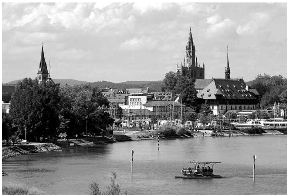
A mai Konstanz látképe a székesegyházzal és a zsinat épületével

Az 1417-ben Konstanzba visszatérő Zsigmond és V. Henrik angol király képviselőinek szövetsége és határozott álláspontja kellett ahhoz, hogy a zsinat végre az egyházszakadás megszüntetése ügyében is előbbre jut-