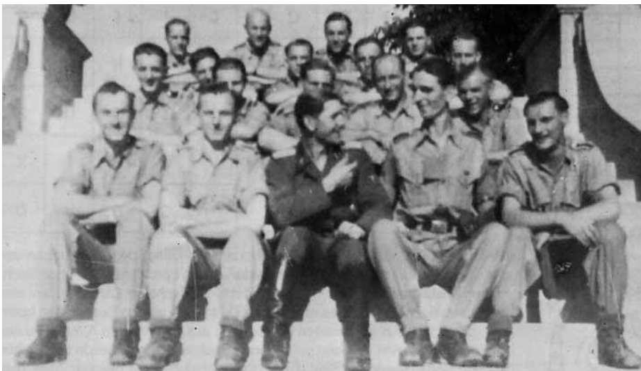
Altisztek csoportképe a Déri-kertben