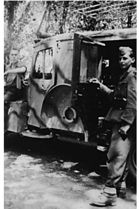
Rádiós jármű híradós keretgyakorlaton Baja környékén

Május 10-én két fő érkezett a nürnbergi pótzászlóaljól Bajára a távbeszélő századhoz. Ők nem újoncok voltak, hanem híradó szakkiképzésen átesett legénységi állományú katonák – ebből az állománycsoportból volt a legnagyobb hiány az orosz fronton elszenvedett súlyos veszteségek után. Így minden egyes fő nagy érték volt a zászlóalj számára, egyébként is, ahogy a mondás tartotta: „a birodalmi tizedesek (Reichsrottenführer) adják a hadsereg gerincét”. Az újoncok közül előbb kiválogatták azokat, akik híradó szolgálatra alkalmasnak mutatkoztak, a többieket a hadosztály egyéb egységeihez irányították át.